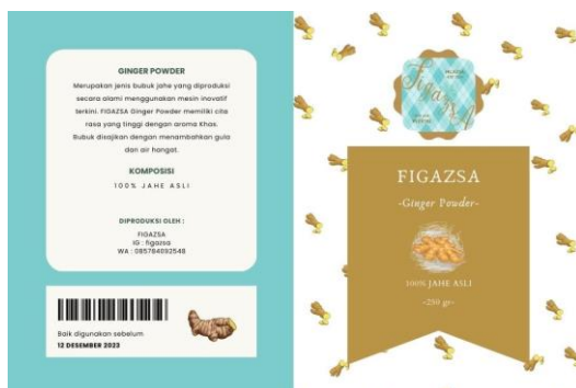
Gambar 3. Kemasan Ginger Powder