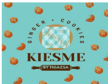
Gambar 4. Kemasan KIESME