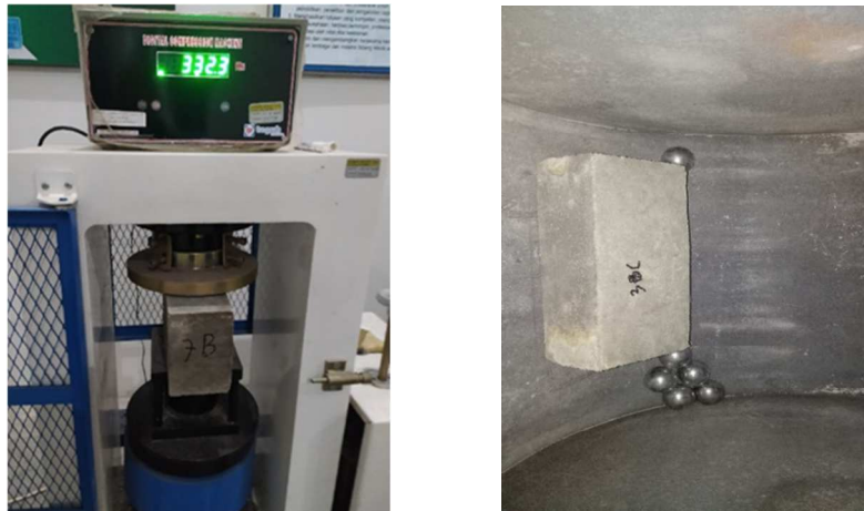
Gambar 2. Uji kuat tekan batako dan Uji ketahanan aus batako