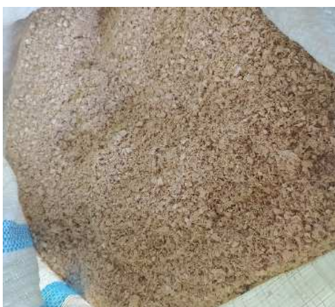
Gambar 1. Bonggol Jagung sebelum dan sesudah dihaluskan