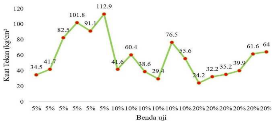
Gambar 4 Grafik Pengujian Kuat Tekan Batako