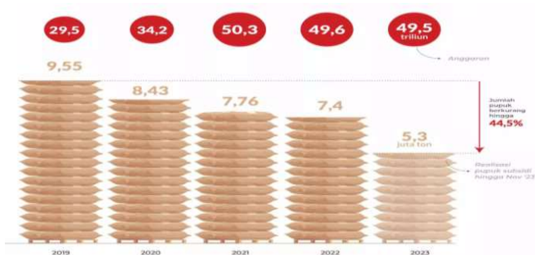
Tabel 2: Subsidi Pupuk 2023 sebesar 49,5 Trilyun Rupiah Ilustrasi: Investor Daily

triliun telah naik signifikan 26,9% dari belanja ketahanan pangan pada 2022 sebesar Rp88,8 triliun. Alokasi anggaran yang mengalami lonjakan signifikan yakni untuk penyaluran pupuk subsidi mencapai Rp42,1 triliun atau setara 6,1 juta ton pupuk subsidi (Rachmawati, 2024).