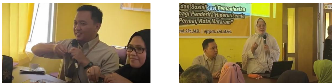
Gambar 2. Sosialisasi bahaya hiperurisemia dan pengenalan Songgak kepada sasaran di aula Kantor Lurah Tanjung Karang Permai, Kota Mataram