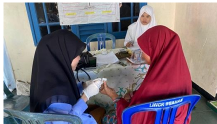
Gambar 1. Kegiatan skrining sasaran dengan riwayat hiperurisemia pada posyandu Kelurahan Tanjung Karang Permai (Posyandu Batang Hari, lingkungan Bougenville dan Posyandu Seroja I, lingkungan Asahan I