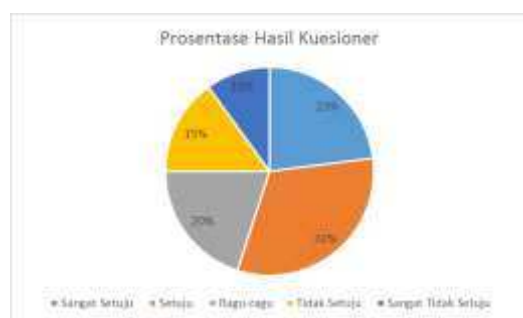
Diagram 1: Persentase Hasil Kuesioner

Adapun hasil rekapitulasi kuesioner adalah sebagai berikut: Sangat Setuju (23), Setuju (32), Ragu-ragu (20), Tidak Setuju (15), dan Sangat Tidak Setuju (10).