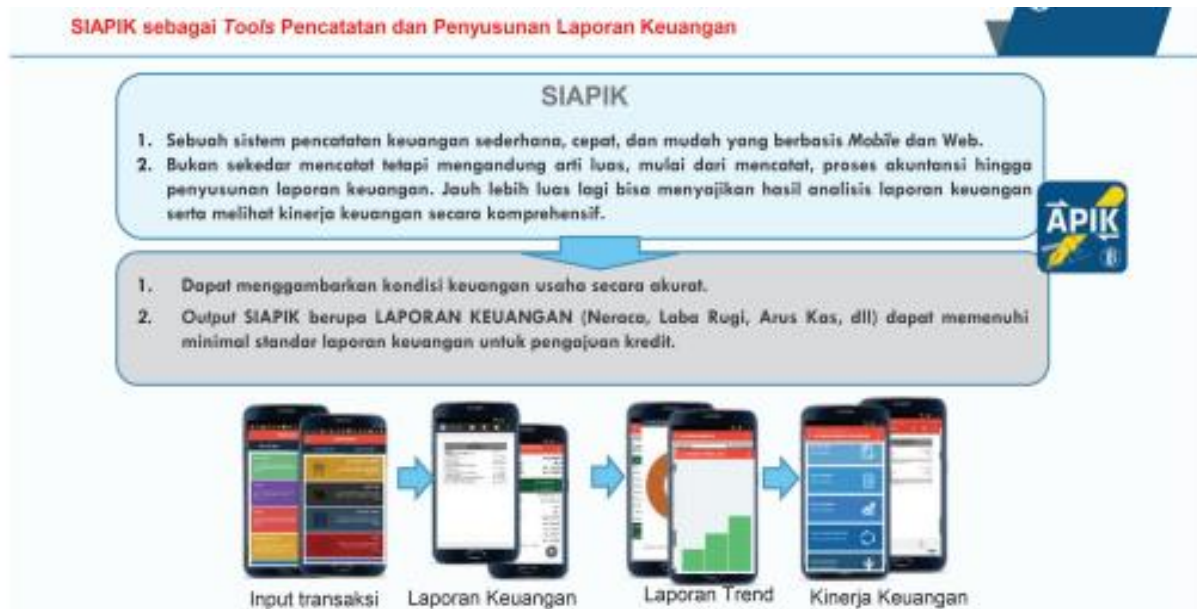
Gambar 1. SIAPIK Sebagai Tools Pencatatan dan Penyusunan Laporan Keuangan

Aplikasi SIAPIK merupakan sebuah sistem pencatatan keuangan sederhana, cepat, dan mudah. Penggunaan aplikasi SIAPIK berbasis mobile dan web di mana melalui web aplikasi ini bisa digunakan pada perangkat laptop, personal computer (PC), dan mini tablet. Sedangkan mobile aplikasi ini bisa digunakan di handphone yang berbasis android sehingga bisa di download dengan mudah melalui App Store.