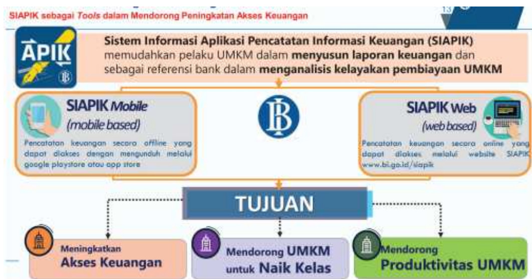
Gambar 2. SIAPIK Sebagai Tools Pencatatan dalam Mendorong Peningkatan Akses Keuangan

Berdasarkan gambar 2 dengan tersedianya kemudahan UMKM mendapatkan akses pembiayaan maka kemampuan UMKM untuk dapat naik kelas semakin besar. Di samping itu dorongan UMKM untuk naik kelas secara otomatis meningkatnya produktivitas yang dihasilkan sehingga multiple effect yang dihasilkan dari peningkatan produktivitas tersebut akan berdampak positif bagi lingkungan di sekitarnya seperti peningkatan ekonomi keluarga UMKM, peningkatan ekonomi di lingkungan sekitar dan meningkatnya ketersediaan lapangan pekerjaan.