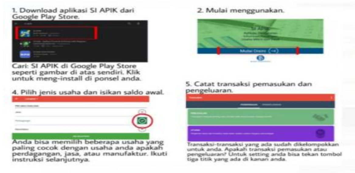
Gambar 3. Langkah-langkah penggunaan SI APIK

melakukan penginputan transaksi penerimaan dan pengeluaran pada menu transaksi di Aplikasi SI APIK.