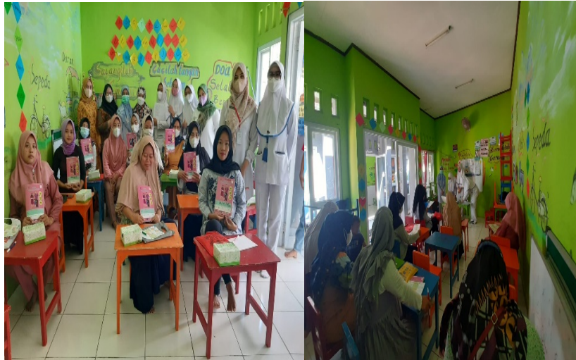
Gambar 2. Proses Kegiatan Pretest, Penyuluhan dan Posttest

materi gizi yang telah disampaikan, untuk peserta yang mendapatkan perolehan nilai tertinggi mendapatkan cendara mata sebagai kenang-kenangan.