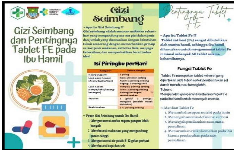
Gambar 3. Leaflet Gizi Seimbang dengan Menu Isi Piringku (Kemenkes, 2014)

Kelas ibu hamil di Posyandu Nanas sangat senang dengan adanya kegiatan pengabdian ini, selain kegiatan ini dapat menambah wawasan tentang gizi seimbang dan pentingnya Tablet FE selama hamil juga dilakukan pemeriksaan kadar Hb, sehingga ibu dapat mengetahui kadar Hbnya. Untuk ibu hamil yang mengalami anemia maka dilakukan pengobatan lebih lanjut ke Puskesmas Suradita. Bidan desa yang bertanggung jawab di Posyandu Nanas sebagai Bidan dari Puskesmas Suradita, ibu kader posyandu Nanas juga merasa senang dan terbantu dengan adanya kegiatan ini selain dapat menambah wawasan juga dapat memberikan sesuatu yang bermanfaat untuk kelas ibu hamil.