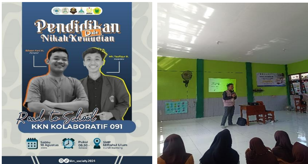
Gambar 2. Penyampaian Materi Oleh Pemateri

Kegiatan sosialisasi “Pendidikan Dulu Nikah Kemudian” diadakan untuk membantu para siswa memahami pentingnya pendidikan, dengan tujuan untuk mencegah dan mengurangi jumlah pernikahan dini. Diharapkan, setelah siswa memahami pentingnya pendidikan untuk masa depan mereka, mereka akan lebih memilih untuk fokus pada akademik mereka. Kegiatan sosialisasi berjalan dengan baik dan anak-anak memberikan respon yang positif, terlihat dari antusiasme mereka selama sesi tanya jawab seperti bertanya ataupun memberi jawaban dari pertanyaan pemateri. Dalam memahami makna pentingnya pendidikan, peserta diberikan materi mengenai hakikat pendidikan, anjuran syariat untuk memiliki ilmu pengetahuan (pendidikan) dan juga motivasi berupa quotes-quotes mengenai pentingnya adab (budi pekerti) dan pentingnya memiliki pengetahuan (pendidikan) yang tinggi. Hal ini sejalan dengan pernyataan Ki Hajar Dewantara bahwa daya upaya untuk memajukan bertumbuhnya budi pekerti (kekuatan batin dan karakter), pikiran ( intellect ), dan tubuh anak adalah pendidikan. Tujuan pendidikan dibagi menjadi tiga (3) kategori: mengembangkan budi pekerti yang baik, memperluas kecerdasan pikiran, dan mencapai kesehatan jasmani (Setyorini & Asiah, 2021).