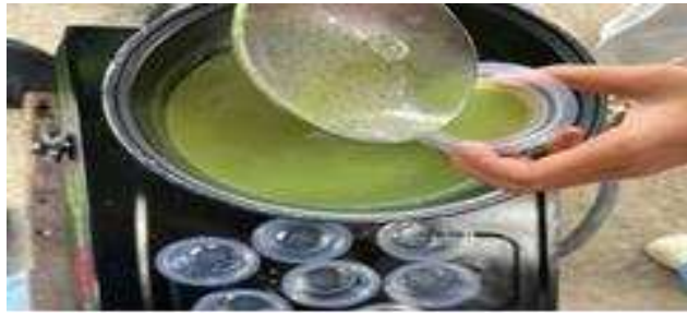
Gambar 3. Proses Pembuatan Agar-Agar Daun Kelor