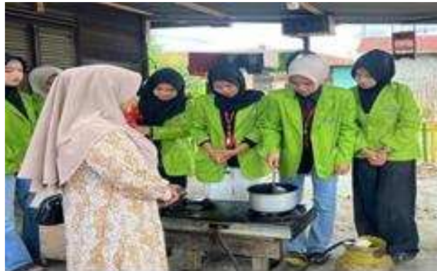
Gambar 4. Demonstrasi Pembuatan Agar-Agar Kepada ibu Menyusui Desa Sipangko

Hasil dari penentuan prioritas penyebab masalahnya adalah adanya ibu yang tidak mampu memenuhi kebutuhan dan hak pada bayinya yaitupemberian asi eksklusif dengan masalah utama penyebab asi tidak eksklusif yaitu asi yang tidak keluar pada hari pertama post-partum sehingga ibu sering memberikan susu formula untuk membantu bayi dalam mencukupi asupannya. Dalam hal ini jika masalah tidak dihadapi sedini mungkin akan menyebabkan pencapaian asi eksklusif akan tetap mengalami masalah sehingga sebagai petugas kesehatan harus memberikan edukasi dan pengertian kepada ibu untuk meningkatkan usaha dalam memberikan asi kepada anaknya hingga usia 6 bulan penuh. Komplikasi yang sering terjadi jika bayi tidak mendapatkan asi eksklusif diantaranya bayi akan sering sakit, obesitas, dan diare. Daun kelor mengandung senyawa fitosterol yang berfungsi meningkatkan dan memperlancar produksi ASI (efek laktagogum) (Hernita, Jihan Rabi'al and Nurul Husna 2024).