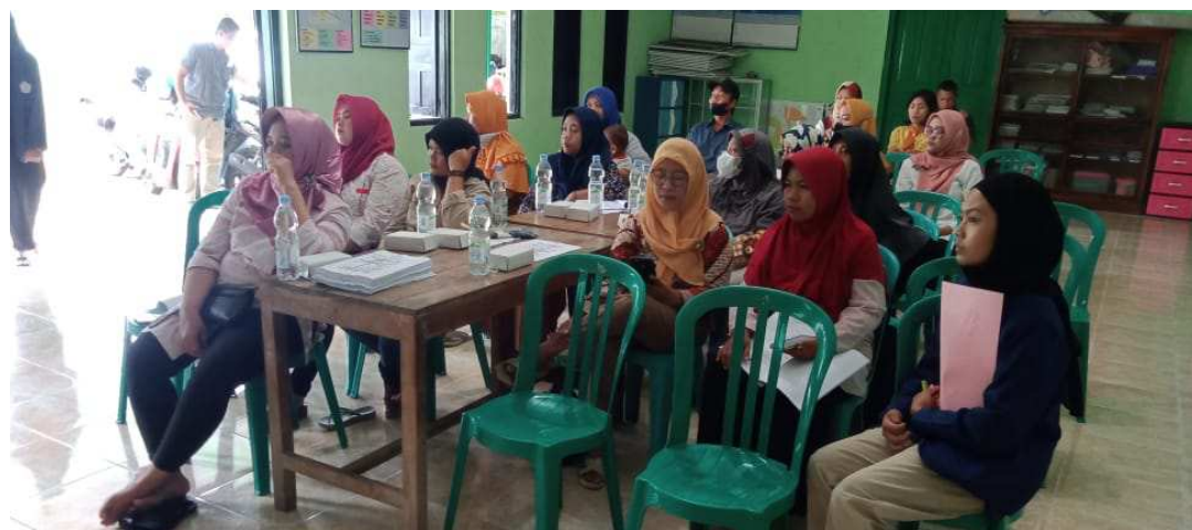
Gambar 1. Peserta Pengabdian kepada Masyarakat

Setelah peserta pengabdian berkumpul. Kegiatan diawali dengan pemaparan materi mengenai branding . Penjelasan mengenai maksud dari branding serta tujuan dan manfaat branding dijelaskan oleh pemateri yang merupakan dosen Universitas Widya Dharma Klaten. Pemaparan ini penting karena memberikan gambaran kepada peserta mengenai pentingnya branding bagi UMKM. Materi selanjutnya yang diberikan pada peserta Pengabdian Masyarakat ini adalah tentang kegunaan Aplikasi Canva dalam branding .