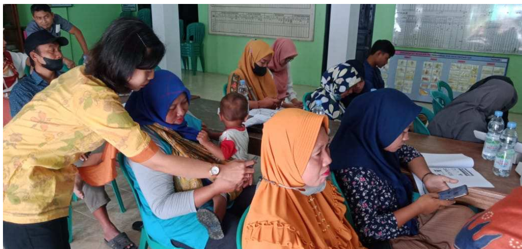
Gambar 3. Pendampingan Pelatihan Canva

Peserta pelatihan antusias untuk mengikuti materi yang disampaikan oleh Dosen dari Universitas Widya Dharma Klaten. Hal tersebut, karena materi yang disampaikan telah disesuaikan terlebih dahulu dengan kebutuhan para pelaku UMKM Desa Jiwo Wetan. Antusiasme para pelaku UMKM dibuktikan dengan keaktifan mereka dalam bertanya baik saat pemaparan materi maupun saat pelatihan branding dan Aplikasi Canva.