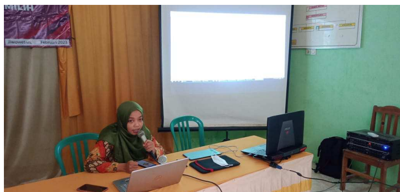
Gambar 2. Pemaparan Materi Branding

Pengabdian masyarakat di Desa Jiwo Wetan telah dilaksanakan sesuai dengan jadwal yang ditentukan. Kegiatan yang diikuti oleh 21 pelaku UMKM Desa Jiwo Wetan terlaksana sebanyak dua kali, yaitu tanggal 30 Januari 2023 dan 15 Februari 2023. Peserta yang juga pelaku UMKM Desa Jiwo Wetan mayoritas adalah ibu-ibu rumah tangga. Proses penyampaian materi dan pelatihan mengenai branding maupun Aplikasi Canva untuk branding dilakukan di Balai Desa Jiwo Wetan dengan baik dan penuh rasa kekeluargaan.