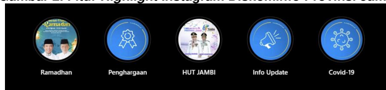
Gambar 2. Fitur Highlight Instagram Diskominfo Provinsi Jambi