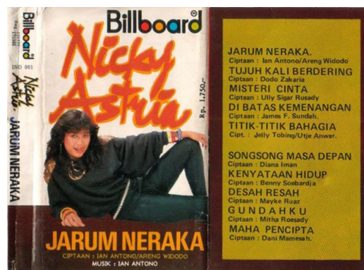
Gambar 2. Sampul album kaset Jarum Neraka

Setelah selesai proses rekaman, album ini tidak bisa langsung dirilis karena perusahaan rekaman AMK Record mengalami masa yang tidak kondusif atau tidak baik di dalam perusahaannya. Karena hal tersebut, akhirnya data master album Jarum Neraka dijual ke Billboard Indonesia. Berbeda dengan album pertamanya, penjualan kaset album Jarum Neraka ini dapat dikatakan sangat sukses.