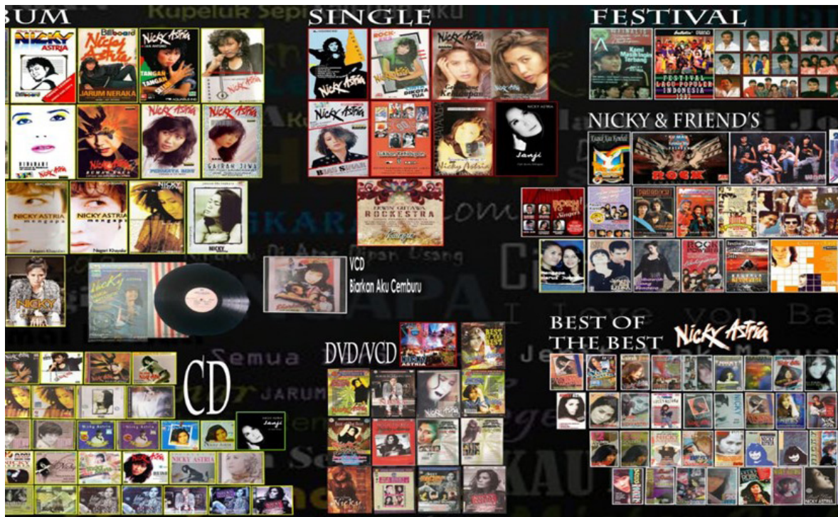
Gambar 3. Foto – foto dari album kaset, CD dan DVD Nicky Astria