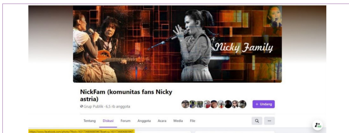
Gambar 4. Akun Facebook NickFam