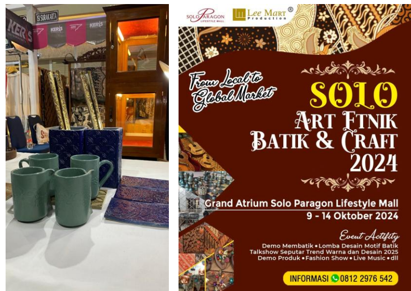
Gambar 15. Promosi produk hasil pelatihan dalam event Solo Art Etnik Batik & Craft 2024 Di Atrium Solo Paragon Mall (Foto: Izza, 8 Mei 2024)