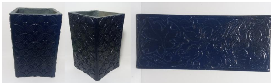
Gambar 14. Hasil pelatihan berupa produk vas dan dekorasi dinding (Foto: Sutri, 8 Mei 2024)