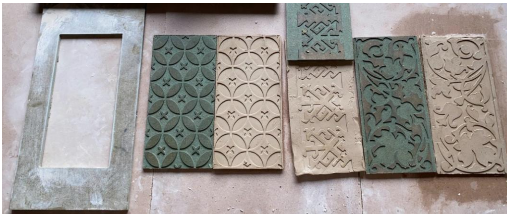
Gambar 6. hasil cetakan motif batik pada media tanah liat dari para peserta pelatihan (Foto: Rahayu Adi, 27 April 2024)

Adapun di sela-disela proses pelatihan, tim Instruktur juga menyisipkan pemahaman tentang keselarasan karakteristik motif batik yang dapat diterapkan sebagai dekorasi pada media keramik. Mengingat terdapat keterbatasan kemampuan cetakan dari kayu untuk mereproduksi detail motif batik, dimana perlu mempertimbangkan ukuran dan tingkat kerumitan ukiran pada cetakan kayu. Maka dari itu motif yang dipilih harus memperhatikan ketepatan ukuran dan repetisi agar sesuai untuk dicetak pada tanah liat. Para peserta ternyata telah mempersepsi motif-motif sederhana, seperti motif geometris pada kawung sebagai motif yang lebih mudah diterapkan dengan cetakan kayu. Sementara untuk pemberian motif isian dan isen-isen dapat dilakukan setelah pencetakan agar memperindah hasil cetakan dengan nuansa batik. Mengingat citra visual dari batik erat kaitannya dengan penerapan komponen isian dan isen-isen .