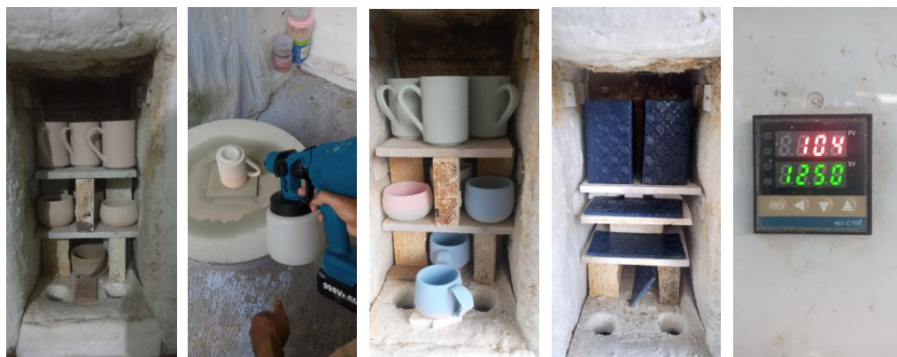
Gambar 11. Pendampingan proses pembakaran biskuit dan pembakaran glasir dengan pengaturan penataan benda kerja, suhu pembakaran dan waktu pembakaran (Foto: Sutri, 7 Maret 2024)

Setelah pengeringan selesai, tim instruktur memberikan pelatihan tentang langkah menguatkan struktur tanah liat melalui tahap pembakaran biskuit sebelum proses pewarnaan glasir. Pembakaran pertama dilakukan pada suhu sekitar 900-1000°C, menghasilkan keramik yang keras tetapi masih dapat menyerap glasir. Pada tahap ini, peserta diperkenalkan pada konsep pembakaran keramik dengan ilustrasi proses oven kue namun perbedaannya pada ketepatan suhu serta waktu pembakaran supaya hasil pembakaran tidak retak atau bentuk benda terdeformasi. Setelah pembakaran biskuit selesai, produk kemudian dilanjutkan ke tahap pewarnaan dengan menggunakan glasir, yang akan memberikan lapisan warna dan menambah estetika visual produk. Peserta diajarkan cara mengaplikasikan glasir dengan kuas dan penyemprotan pencelupan, serta pentingnya memastikan bahwa lapisan glasir tidak terlalu tebal atau tipis. Adapun tahap akhir adalah pembakaran glasir diatur pada suhu yang lebih tinggi, sekitar 1200-1300°C, untuk menghasilkan hasil akhir keramik yang mengkilap. Proses ini disertai dengan evaluasi terhadap hasil karya peserta, di mana mereka merefleksikan tantangan dan keberhasilan yang mereka alami selama pelatihan.