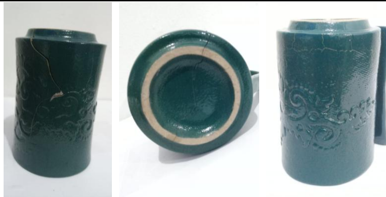
Gambar 12. Contoh hasil pembakaran produk yang retak menjadi diskusi keteknikan dengan para peserta pelatihan

Adapun berdasarkan evaluasi pada produk memperlihatkan beberapa temuan deformasi bentuk dan keretakan pada permukaan keramik setelah proses pembakaran. Namun demikian karya yang dihasilkan berhasil membawa motif batik tradisional ke dalam bentuk yang lebih kontemporer dan fungsional, sejalan dengan teori nilai tambah produk kerajinan tradisional. Hasil produk yang berupa vas, gelas, dan berbagai bentuk dekoratif berhasil mengadaptasi motif batik geometris dengan detail motif yang konsisten. Penggunaan motif batik tradisional ini tidak hanya menjaga nilai-nilai budaya, tetapi juga berupaya menambah daya tarik kontemporer yang lebih diterima oleh pasar modern. Dari segi teknis dan produktivitas, hasil cetakan produk keramik batik yang berhasil telah menunjukkan ketepatan proses produksi yang teridentifikasi dari stabilitas bentuk yang baik. Hal yang demikian terlihat dari permukaan keramik yang memiliki hasil glasir yang merata dan tidak mengalami perubahan warna yang signifikan. Namun demikian masih diperlukan pelatihan khusus dalam penerapan glasir dan pembakaran pada suhu yang tepat karena memengaruhi ketahanan dan tampilan akhir produk.