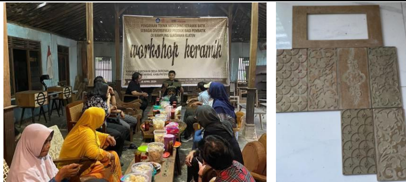
Gambar 4. Pemaparan materi dari Tim Instruktur dengan cara ceramah tentang alat cetakan keramik motif batik (Foto: Izza, 27 April 2024)

Selanjutnya peserta diberikan kesempatan untuk berlatih secara langsung dengan didampingi oleh tim pengajar yang siap memberikan umpan balik. Pendampingan ini dirancang untuk meminimalisir kesalahan dan meningkatkan pemahaman peserta. Adapun kesalahan umum yang ditemui selama proses ini adalah kurang meratanya tekanan saat mencetak sehingga menyebabkan motif batik tidak tercetak dengan baik. Pemahaman peserta pada keteknikan cetak ini terlihat setelah para peserta berlatih mencetak sebanyak 3 kali cetakan. Hasilnya terlihat dari konsistensi tekanan saat mencetak sehingga menghasilkan motif batik dengan hasil yang seragam.