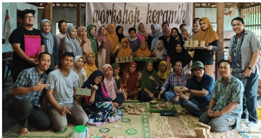
Gambar 10. Tim PKM ISI Surakarta bersama pemateri dan peserta pelatihan berfoto bersama dengan hasil karya dari pelatihan (Foto: Ardi, 27 April 2024)