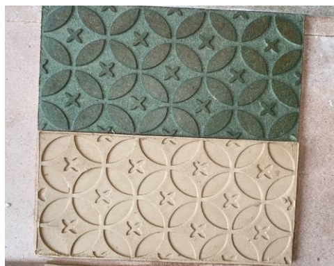
Gambar 1. Simulasi pengujian cap bermotif batik kawung pada tanah liat (Foto: Izza, 8 Maret 2024)

Pelibatan aktif peserta pelatihan terlihat dari inisiatif mereka yang terlibat membantu mempersiapkan alat dan bahan sebagai alat cetakan, tanah liat, serta peralatan pembentukan. Kolaborasi lintas keterampilan juga dilakukan dengan mengajak partisipasi keluarga peserta pelatihan dalam membuat cetakan kayu yang diukir motif batik dan mengevaluasi efektivitas penggunaannya. Hal yang demikian turut memperkuat dimensi partisipatif dari program pemberdayaan masyarakat sehingga diharapkan dapat berkelanjutan sebagai upaya menjawab manajemen produksi. Secara spesifik tim instruktur ISI Surakarta juga menyiapkan alat-bahan pembuatan keramik yang disesuaikan dengan standar produksi keramik, guna memastikan kualitas karya hasil pelatihan.