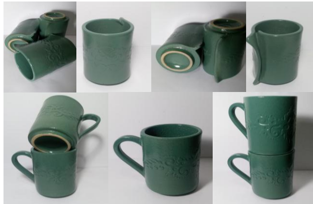
Gambar 13. Hasil pelatihan berupa produk gelas dengan motif batik lung bengawan