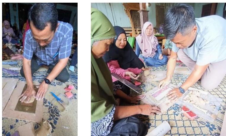
Gambar 5. Tim Instruktur sedang mendemonstrasikan teknik cetak tekan motif batik pada media tanah liat (Foto: Rahayu Adi, 27 April 2024)

Selanjutnya peserta diberikan kesempatan untuk berlatih secara langsung dengan didampingi oleh tim pengajar yang siap memberikan umpan balik. Pendampingan ini dirancang untuk meminimalisir kesalahan dan meningkatkan pemahaman peserta. Adapun kesalahan umum yang ditemui selama proses ini adalah kurang meratanya tekanan saat mencetak sehingga menyebabkan motif batik tidak tercetak dengan baik. Pemahaman peserta pada keteknikan cetak ini terlihat setelah para peserta berlatih mencetak sebanyak 3 kali cetakan. Hasilnya terlihat dari konsistensi tekanan saat mencetak sehingga menghasilkan motif batik dengan hasil yang seragam.