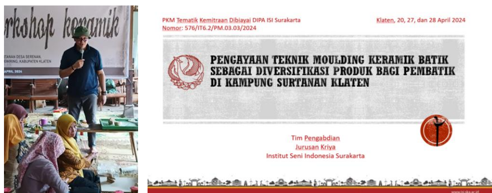
Gambar 2. Tim Penciptaan memberikan ceramah tentang strategi diversifikasi produk (Foto: Izza, 20 April 2024)

Metode ceramah selama pelatihan dilakukan dengan menggunakan bahasa Jawa sebagai bahasa yang akrab digunakan dalam keseharian masyarakat setempat. Tujuannya untuk memfasilitasi kemudahan pemahaman dalam menanamkan pola pikir pengembangan produk supaya tidak tergantung pada produksi satu jenis kerajinan semata. Ceramah yang dilakukan tim instruktur berupaya menjelaskan cara diversifikasi produk sebagai strategi dalam menciptakan variasi produk melalui pengayaan keterampilan dan kolaborasi keteknikan. Para peserta diajak untuk melihat keterampilan batik mereka sebagai potensi yang dapat dikembangkan ke dalam media yang berbeda serta menciptakan peluang baru dalam sektor kerajinan. Penyampaian ceramah perihal pengetahuan dasar diversifikasi produk itu telah membantu peserta mempersepsi relevansi dan manfaat praktis dari pelatihan yang diajarkan.