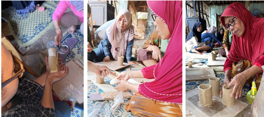
Gambar 7. Tim instruktur mendampingi peserta pelatihan dalam membentuk hasil cetakan motif batik menjadi produk fungsional berupa gelas

pengenalan sifat elastisitas tanah liat, lem tanah liat dan alat bantu pembentukan agar hasil pembentukan mencapai konsistensi bentuk yang sesuai. Tahap pembentukan menggunakan alat bantu pipa dan papan untuk membentuk hasil cetakan menjadi produk vas dan gelas tanpa merusak motif batik yang telah tercetak.