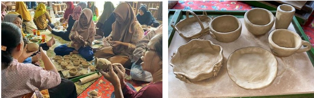
Gambar 3. Peserta pelatihan mempraktikkan teknik pembentukan tanah liat (kiri) dan salah satu hasil simulasi keteknikan pembentukan tanah liat (kanan) (Foto: Izza, 20 April 2024)

instruktur menggunakan rangsangan melalui demonstrasi pembentukan tanah liat yang ternyata berhasil meningkatkan rasa ingin tahu peserta sehingga mereka turut mensimulasikan bagaimana perlakuan terhadap tanah liat dengan teknik pijit, teknik pilin dan tekni slab. Tanggapan peserta terlihat positif dan antusias dengan menganggap kemudahan berkerajinan dengan media tanah liat seperti membuat adonan kue. Di sisi lain, selama ceramah berlangsung anggota tim instruktur berbagi peran dengan turut mendampingi peserta melalui simulasi keteknikan dengan berlatih membuat produk keramik fungsional seperti vas, piring, dan gelas.