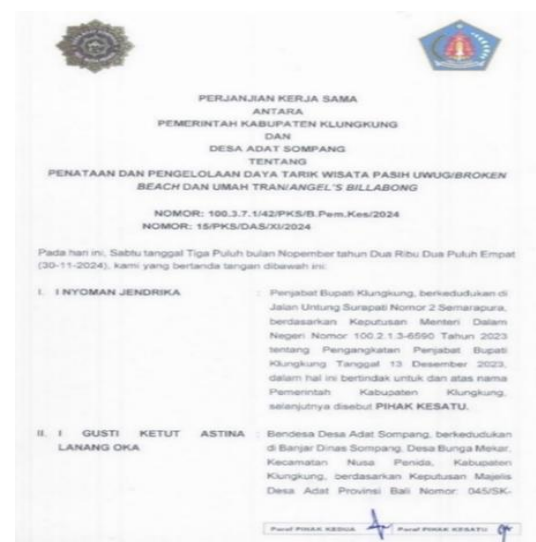
Gambar 3. Dokumen Perjanjian Kerja Sama Antara Pemerintah Kabupaten Klungkung dan Desa Adat Sompang

Seluruh tenaga kerja, termasuk tukang parkir, petugas keamanan, dan tenaga kebersihan, berada di bawah pengawasan dan tanggung jawab Desa Adat Sompang. Pengaturan ini merupakan hasil kesepakatan antara Pemerintah Kabupaten Klungkung dan Desa Adat Sompang melalui MoU ( Memorandum of Understanding ), yang ditandatangani oleh Pejabat Bupati Klungkung dan Bendesa Desa Adat Sompang. Kesepakatan ini bertujuan untuk meningkatkan layanan keamanan dan kebersihan di sekitar objek wisata, serta memperbaiki citra pariwisata Kabupaten Klungkung dan menarik lebih banyak wisatawan ke Broken Beach dan Angels Billabong .