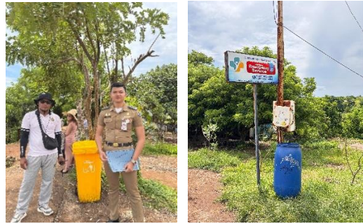
Gambar 4. Tempat Pembuangan Sampah di Objek Wisata Broken Beach Nusa Penida Yang Belum Sesuai Regulasi

Petugas kebersihan juga berperan aktif memantau dan membersihkan area secara berkala. Dengan demikian, objek wisata ini tidak hanya menawarkan keindahan alam, tetapi kelestarian lingkungan. juga pengalaman berwisata yang nyaman dan bertanggung jawab. Upaya ini sekaligus menjadi edukasi bagi pengunjung untuk lebih peduli terhadap lingkungan sekitar.