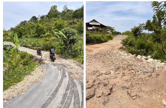
Gambar 2. Kondisi Jalan Menuju Objek Wisata Broken Beach

Hal ini dikarenakan harga tiket asli sebenarnya sudah termasuk dalam biaya tiket fast boat yang dikelola oleh pemerintah daerah (pemda). Dengan demikian, retribusi yang rendah ini diharapkan dapat tetap mendukung perawatan dan pengembangan fasilitas di destinasi wisata tanpa membebani pengunjung secara berlebihan. Namun, disisi lain, mengenai keluhan akses jalan menuju Broken Beach yang rusak dan kurang memadai telah banyak disampaikan oleh beberapa pengunjung. Berikut pada gambar 2 akan dilampirkan mengenai kondisi akses jalan menuju Objek Wisata Broken Beach Nusa Penida.