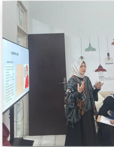
Gambar 2. Pemberian Materi Psikoedukasi

turut dilengkapi dengan sharing session bersama narasumber dan petugas layanan guna memperdalam pemahaman peserta terhadap materi yang disampaikan, sekaligus menjadi wadah untuk berbagi pengalaman dan melibatkan peserta dalam sesi tanya jawab.