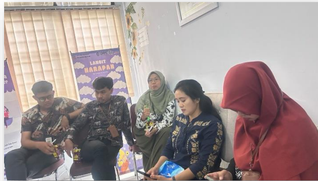
Gambar 3. Pemberian Pre-Test & Post-Test

Tahapan ketiga dalam kegiatan ini adalah melakukan evaluasi melalui pemberian lembar post-test guna menilai tingkat pengetahuan petugas layanan UPT PPA Provinsi Sulawesi Selatan terkait work-life balance setelah materi psikoedukasi disampaikan. Untuk mengetahui efektivitas kegiatan, dilakukan analisis terhadap data yang dikumpulkan sebelum dan sesudah pelaksanaan. Dengan demikian, metode analisis data yang digunakan adalah membandingkan hasil pre-test dan post-test dari para petugas layanan UPT PPA Provinsi Sulawesi Selatan.