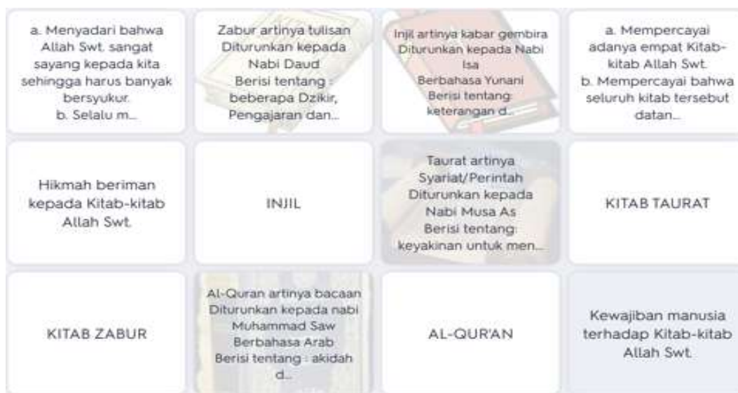
Gambar 3. Fitur Mencocokkan

Selanjutnya yang terakhir pendidik akan memberikan tes kepada peserta didik terkait materi kitab-kitab Allah yang telah dipersiapkan sebelumnya. Tes yang diberikan oleh guru menggunakan dua mode, yaitu evaluasi dan Quizlet live . Melalui fitur ini akan dilakukan penggabungan belajar dengan permainan sosial yang mengasyikkan, fitur Quizlet Live dalam aplikasi Quizlet dapat memotivasi siswa untuk mulai belajar secara mandiri sebagai upaya untuk mempersiapkan permainan/game dalam Quizlet . Dengan demikian Quizlet Live hadir sebagai terobosan baru media pembelajaran yang dapat meningkatkan partisipasi peserta didik di kelas (Wolff, t.t.).