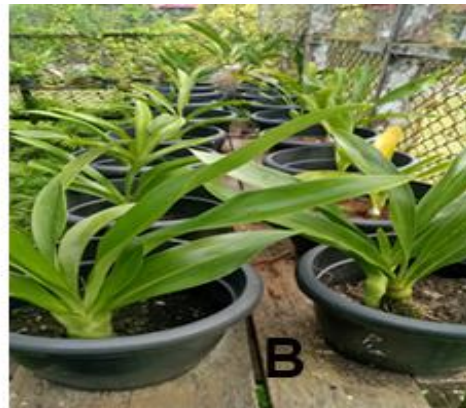
Gambar 1. Penampilan pertumbuhan tanaman anggrek G. scriptum pada saat umur 2 BST (A) dan 5 BST (B)