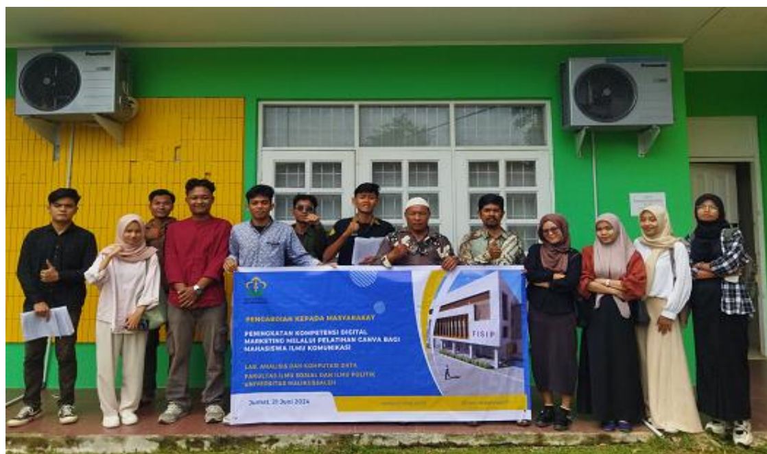
Gambar 2. Peserta Pelatihan Canva untuk Meningkatkan Kompetensi Digital Marketing