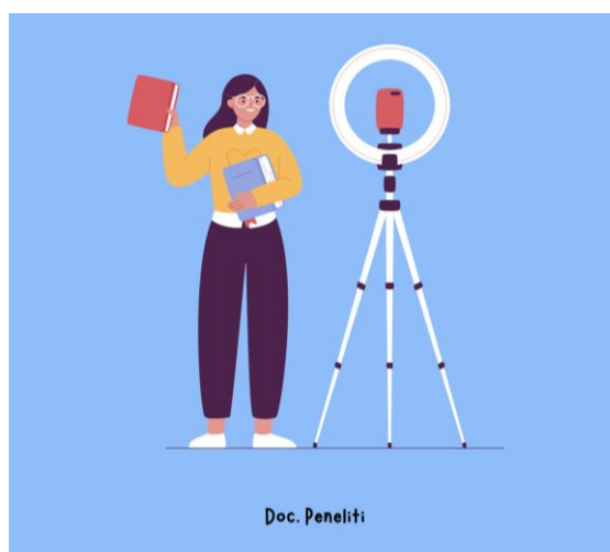
Gambar 1. Ilustrasi siswa Vlogger

Dalam hal ini seorang siswa dapat melakukan pembelajaran dengan vlogger semisal melakukan penghapalan materi belajar lalu divideokan dengan musik yang tepat dan berbantuan editing yang bagus, tentu hal ini akan memberikan sebuah kreativitas setiap siswa dalam kelas. Melatih mereka juga untuk dapat berpartisipasi memberikan pendidikan gratis yang dapat di upload melalui media sosial yang mereka miliki. Kemampuan ini akan terbentun dan memberikan mereka kebiasaan untuk dapat berbicara didepan kamera.