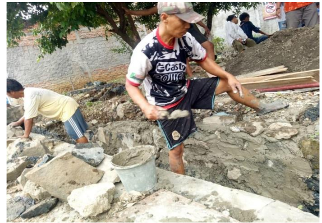
Gambar 4. Foto Gotong Rotong Bersama Warga Sosialisasi dan Edukasi tentang Pencegahan dan penanggulangan bencana banjir

Sosialisasi dan edukasi kepada masyarakat tentang Pencegahan dan penanggulangan bencana banjir telah dilakukan kepada warga RT 005 RW 010 Kelurahan Teluk Pucung pada tanggal 25 Januari 2025, menjadi hal yang sangat penting untuk membuat masyarakat semakin mengetahui dan paham tentang pencegahan dan penanggulangan bencana banjir. Banjir adalah salah satu bencana alam yang paling merusak dan sering kali mempengaruhi banyak daerah di seluruh dunia. Edukasi ini akan menjelaskan pengertian banjir, penyebab utama, jenis-jenis banjir, serta dampaknya terhadap manusia, lingkungan, dan ekonomi.