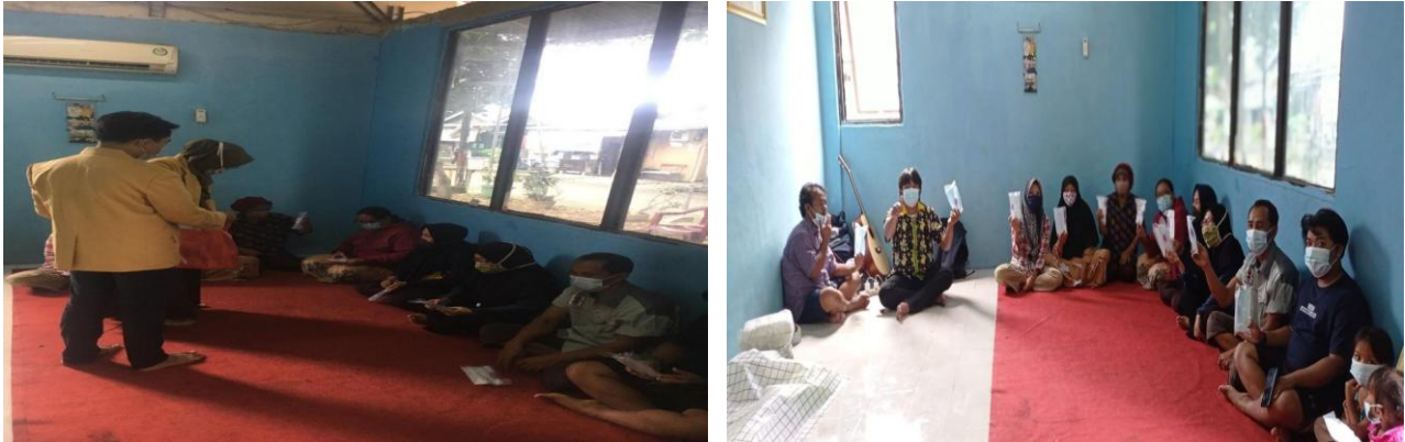
Gambar 5. Sosialisasi dan Edukasi Pencegahan dan Penanggulangan Bencana Banjir

Untuk menghindari bahaya listrik ini dapat dihindari dengan mematuhi standar keamanan, memeriksa instalasi secara berkala, dan tidak menggunakan alat listrik dengan tangan basah atau di area basah seperti kamar mandi dan dapur. Adapun jenis bahaya utama listrik adalah: