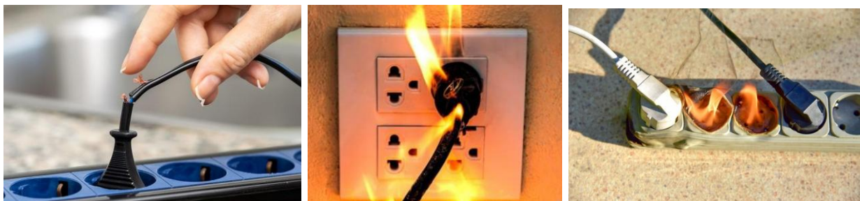
Gambar 6 Bahaya Listrik