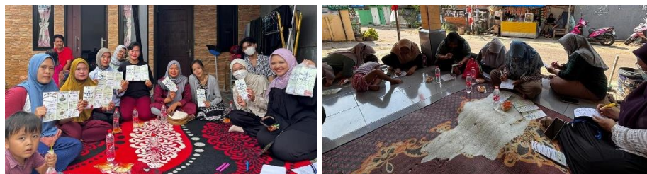
Gambar 3 Dokumentasi Kegiatan “Hidup Sehat Tanpa Obesitas”

Monitoring dilakukan selama kegiatan berlangsung dengan mengamati kehadiran peserta, keaktifan dalam diskusi, serta pemanfaatan media edukasi. Evaluasi intervensi dilakukan dengan membandingkan skor pengetahuan pre-test dan post-test . Analisis data diawali dengan uji normalitas menggunakan uji Shapiro-Wilk untuk mengetahui distribusi data. Karena data tidak berdistribusi normal, maka digunakan uji non-parametrik Wilcoxon Signed Rank Test untuk menganalisis perbedaan skor sebelum dan sesudah intervensi. Tingkat signifikansi ditetapkan pada p < 0,05 . Hasil analisis ini digunakan untuk menilai efektivitas intervensi edukasi dalam meningkatkan pengetahuan peserta mengenai obesitas, infertilitas, gizi seimbang, dan aktivitas fisik.