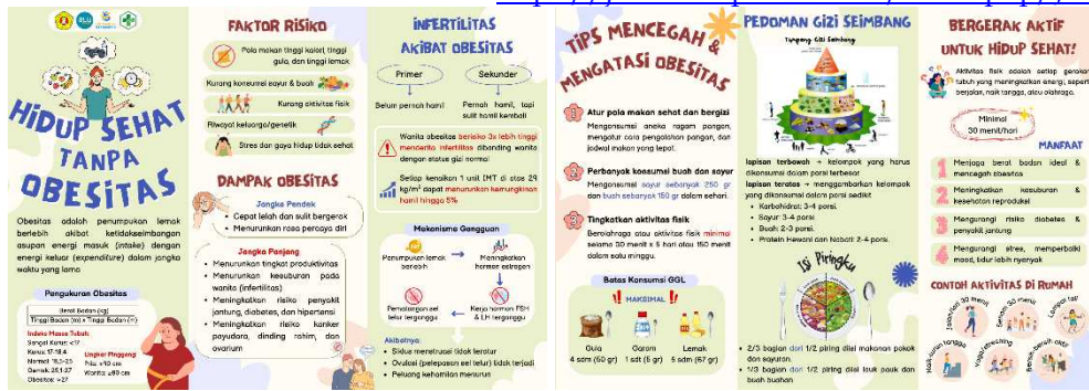
Gambar 2. Leaflet Kegiatan