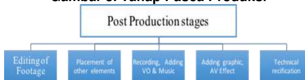
Gambar 3. Tahap Pasca Produksi

Tahap setelah produksi adalah pasca produksi. Dalam produksi video dokumenter pada tahap inilah gambar-gambar ditempatkan bersama-sama untuk menciptakan representasi yang ekspresif. Dalam fase ini terdapat beberapa tahapan proses meliputi