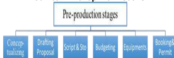
Gambar 1. Tahap Pra Produksi

Tahap setelah pra produksi adalah produksi. Dalam produksi video dokumenter tahap produksi merupakan fase untuk mewujudkan naskah menjadi kenyataan visual. Dalam fase ini terdapat beberapa tahapan proses meliputi: