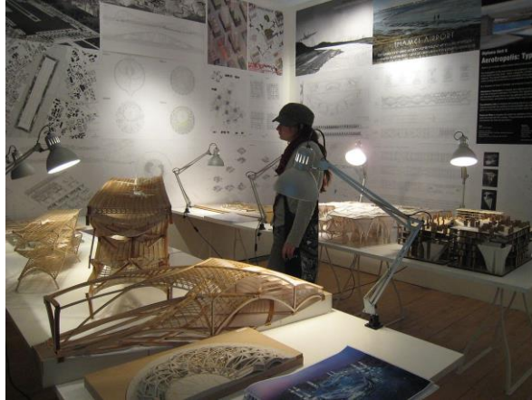
Gambar 4. Fasilitas Studio atau Workshop