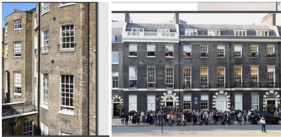
Gambar 3. Tampak bangunan AA School of Architecture

AA School of Architecture adalah sekolah independen yang didirikan di London, Inggris. Sejak didirikan pada tahun 1847, Asosiasi Arsitektur (AA) telah menjadi rujukan global dalam pendidikan arsitektur serta sebagai pencetus bentuk-bentuk penelitian yang baru dan relevan, wacana kritis, dan praktik radikal. Sekolah ini mencetak karir paling luar biasa di bidang arsitektur dan budaya, dan saat ini siswa dari seluruh dunia dapat mendaftar ke berbagai program akademik yang beragam di sekolah ini. Sekolah Arsitektur, Asosiasi Arsitektur (AA) menawarkan kursus lima tahun yang terdiri dari Program Eksperimental (Tahun 1-3, ARB / RIBA Bagian 1) dan Program Diploma (Tahun 4–5, ARB / RIBA Bagian 2), sebagai serta kursus Praktik Profesional yang terakreditasi RIBA, sembilan program Pascasarjana Diajarkan dan program PhD. Program studi tambahan yang tersedia di sekolah termasuk Kursus Foundation, Sekolah Musim Panas dan Sekolah Kunjungan AA: serangkaian lokakarya intensif yang berlangsung baik di London maupun di seluruh dunia.