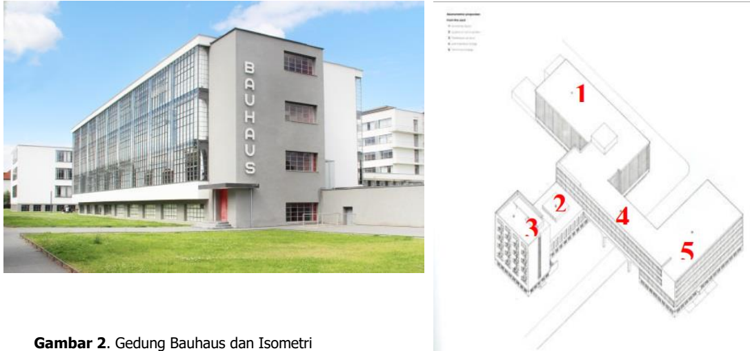
Gambar 2. Gedung Bauhaus dan Isometri