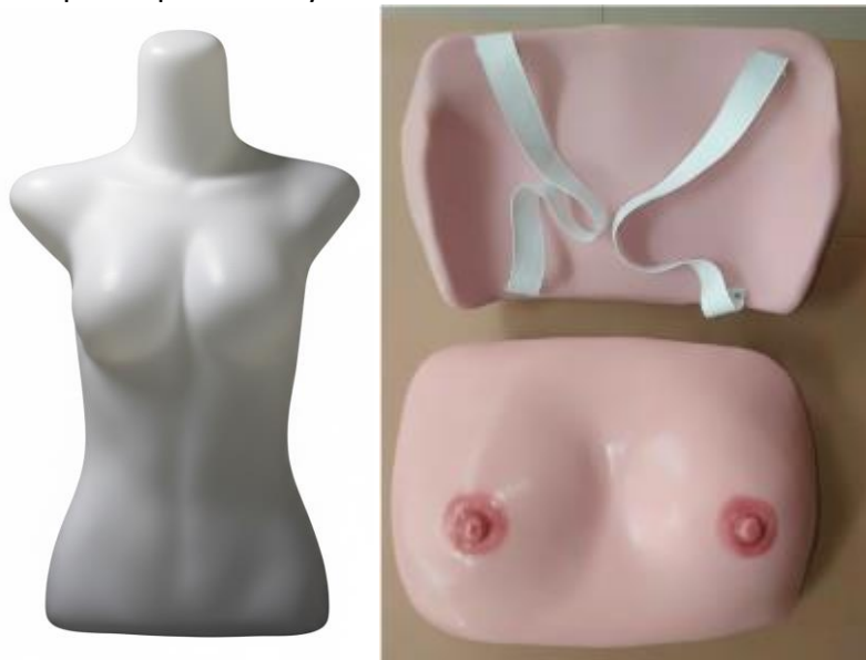
Gambar 1. Phantom / manekin yang dimiliki

Akhirnya, seluruh informasi yang terkumpul dari berbagai sumber tersebut diintegrasikan dan dianalisis secara menyeluruh. Peneliti menyusun laporan studi kelayakan awal yang memuat justifikasi ilmiah dan praktis tentang pentingnya pengembangan prototipe ini. Laporan tersebut mencakup: (1) Gap analisis yang menunjukkan kesenjangan antara kebutuhan pembelajaran dan ketersediaan media; (2) Batasan dan asumsi proyek pengembangan; (3) Spesifikasi teknis dan fungsional yang terukur (misal: payudara harus menghasilkan tetesan setelah tekanan 2-3 N pada kuadran tertentu); serta (4) Indikator keberhasilan tahap desain. Dengan demikian, Tahap Studi Pendahuluan tidak hanya berfungsi sebagai pengumpul informasi, tetapi telah menghasilkan peta jalan (roadmap) yang jelas dan terukur untuk memandu seluruh proses penelitian dan pengembangan prototipe Smart Breast Model pada tahap-tahap berikutnya.