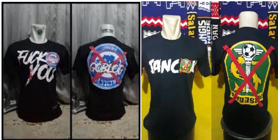
Gambar 2 Kaos Supporter

salam sakit jiwa jan***. Selain coretan di dinding rivalitas ini merambah pada media lainnya seperti halnya kaos.