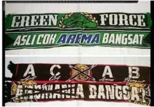
Gambar 3 : syal

Sama halnya dengan kaos syal ini dapat dibeli di online shop seperti buka lapak, lazzada, shopee dengan kata kunci syal rasis. Tentunya media konvensional yang merupakan ekspresi rivalitas antara Bonek dan Aremania selain kaos dan syal masih banyak media konvensional yang digunakan seperti halnya spanduk, pamflet dan lain-lain.