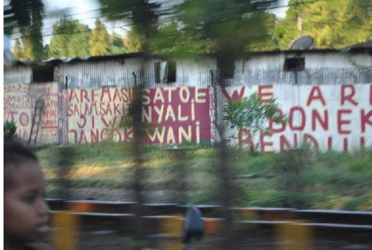
Gambar 1 : Rivalitas Sumber Kompasiana 21 Agustus 2021

Dari gambar di atas sangat jelas sekali rivalitas antara Bonek dan Aremania. Hal ini dapat dilihat dari tulisan Arema a**