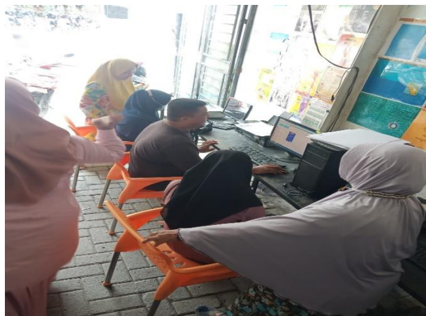
Gambar 4. Kegiatan Pelatihan Sistem Informasi Akuntansi Bagi Karyawan