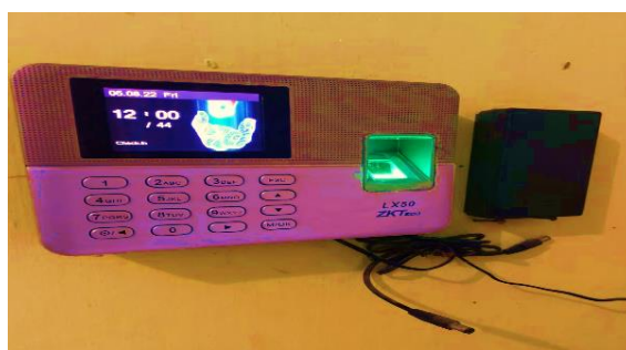
Gambar 1. Alat Yang Digunakan Untuk Menghitung Kehadiran

Selain itu, upaya yang dilakukan dalam pemecahan/penyelesaian masalah yang ada adalah dengan cara menerapkan sistem kehadiran menggunakan alat elektronik atau biasa disebut juga dengan fingerprint , hal ini dilakukan untuk menerapkan kedisiplinan pegawai/karyawan dan dapat memonitoring/mengevaluasi kehadiran karyawan sehingga dapat dipertanggung jawabkan. Alat fingerprint ini membantu pemilik usaha untuk melihat kehadiran atau jam kerja karyawan dan dapat dijadikan rujukan dalam laporan penggajian kehadiran karyawan.