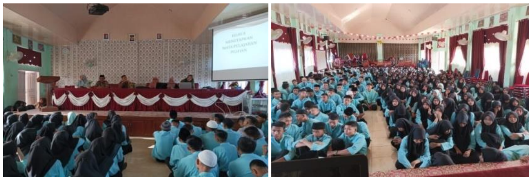
Gambar 2. Proses Sosialisasi Pemilihan Mata Pelajaran Pilihan Bagi Siswa Kelas X

Berikut dokumentasi proses sosialisasi pemilihan mata pelajaran pilihan: