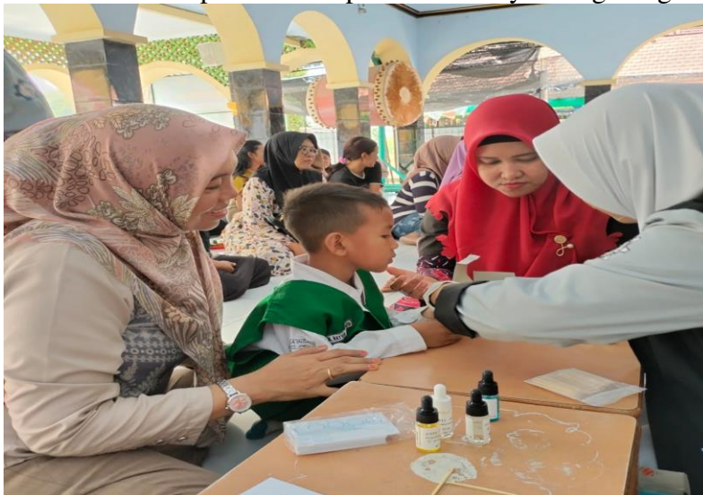
Gambar 1. Proses pemeriksaan golongan darah

Pengabdian masyarakat di TK Bina Insani Candimulyo di awali dengan memberikan penyuluhan pada orang tua siswa tentang pentingnya mengetahui golongan darah pada putra putrinya yang dilakukan oleh team dosen Sedangkan mahasiswa teknologi laboratorium medis yang melakukan Pemeriksaan golongan darah dimulai dengan swab alkohol pada jari, kemudian ditusuk dengan blood lancet. Tetesan darah pertama dibuang, kemudian darah diteteskan pada kertas golongan darah sebanyak 1 tetes menyesuaikan lingkaran pada kertas. Setelah itu ditetesi dengan antigen A dan antigen B. Setelah sekitar 30 – 60 detik, hasil pemeriksaan dapat dapat diketahui golongan darah. Setelah dilaksanakan pemeriksaan golongan darah pada anak pra sekolah sejumlah 20 siswa maka didapatkan hasil pemeriksaan system golongan darah yang bervariasi.