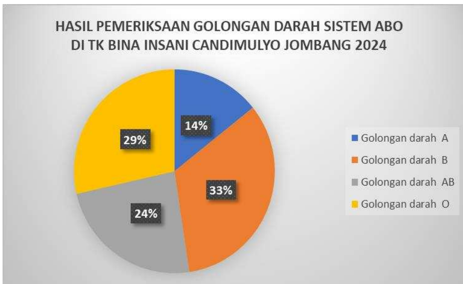
Gambar 3. Hasil pemeriksaan golongan darah sistem ABO

Pada hasil pemeriksaan golongan darah pada diagram pie diatas yang dilaksanakan di TK Bina Insani Candimulyo Jombang diperoleh hasil golongan darah A sebanyak 3 (14%) siswa, golongan darah B sebanyak 7 (33%) siswa, golongan darah AB sebanyak 5 (24%) siswa, dan golongan darah O sebanyak 6 (29%) siswa. Artinya yang paling banyak yaitu type golongan darah B sebanyak 33% siswa. Hal ini berbeda dengan survey yang dilakukan oleh mendagri yang menyebutkan sebagian besar penduduk Indonesia memiliki type golongan darah O (Kemendagri, 2022)