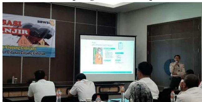
Gambar 2 Sosialisasi Kesiapsiagaan Terhadap Bencana Banjir

Tindakan yang dilakukan oleh pemerintah Provinsi Banten yakni Sosialisasi dan memberikan pelatihan kepada masyarakat yang tinggal di daerah rawan banjir dalam menghadapi banjir. Selain itu membuat Standar Operasi Prosedur bencana Banjir di lingkup RT/RW serta menyiapkan perlengkapan yang relevan dengan bencana banjir, membersihkan saluran pembuangan limbah cair rumah tangga seperti got atau sungai kecil. Badan Penanggulangan Bencana Daerah telah melakukan berbagai pelatihan dan sosialisasi ke masyarakat, sekolah terhadap pentingnya penanggulangan bencana. Adapun kegiatan sosialisasi oleh Badan Penanggulangan Bencana Daerah Provinsi Banten terlihat pada gambar dibawah ini: