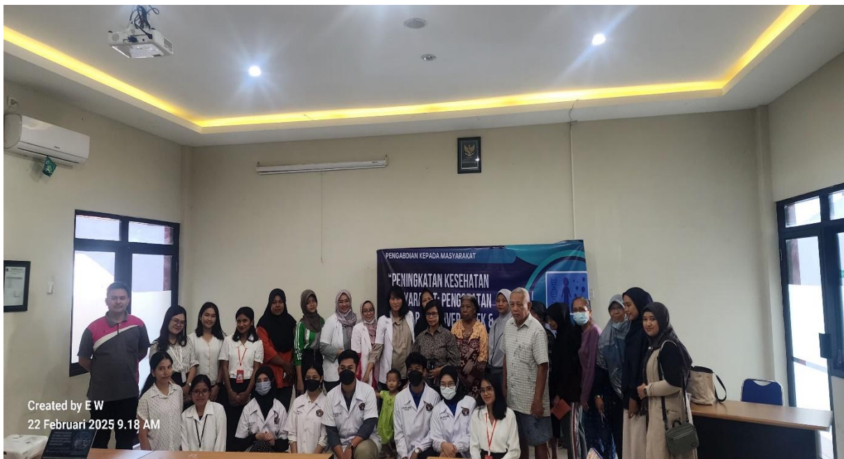
Gambar 2. Foto bersama antara tim pengabdian masyarakat dengan perwakilan masyarakat.

Hasil yang diperoleh dari keluhan pasien yaitu banyak diantaranya memiliki keluhan seperti pusing, nyeri pinggang, nyeri perut, batuk pilek, sesak, sulit tidur, dan pegal-pegal, selanjutnya pemeriksaan tekanan darah. Tekanan darah tinggi atau hipertensi adalah masalah utama bagi masyarakat di Indonesia. mengatur pola makan, berolahraga teratur, dan mengonsumsi mineral seperti kalium dapat mencegah penyakit ini (Herwati and Sartika 2013). Hal ini disebabkan oleh fakta bahwa kalium memiliki kemampuan untuk mempertahankan otot jantung, otot rangka, dan otot polos yang diperlukan untuk pencernaan dan gerakan. Ohishi (2018) menyatakan bahwa kecepatan denyutan jantung yang lebih tinggi, volume darah yang lebih besar, dan resistensi pembuluh darah tepi semuanya berkontribusi pada peningkatan tekanan darah (Ohishi 2018).