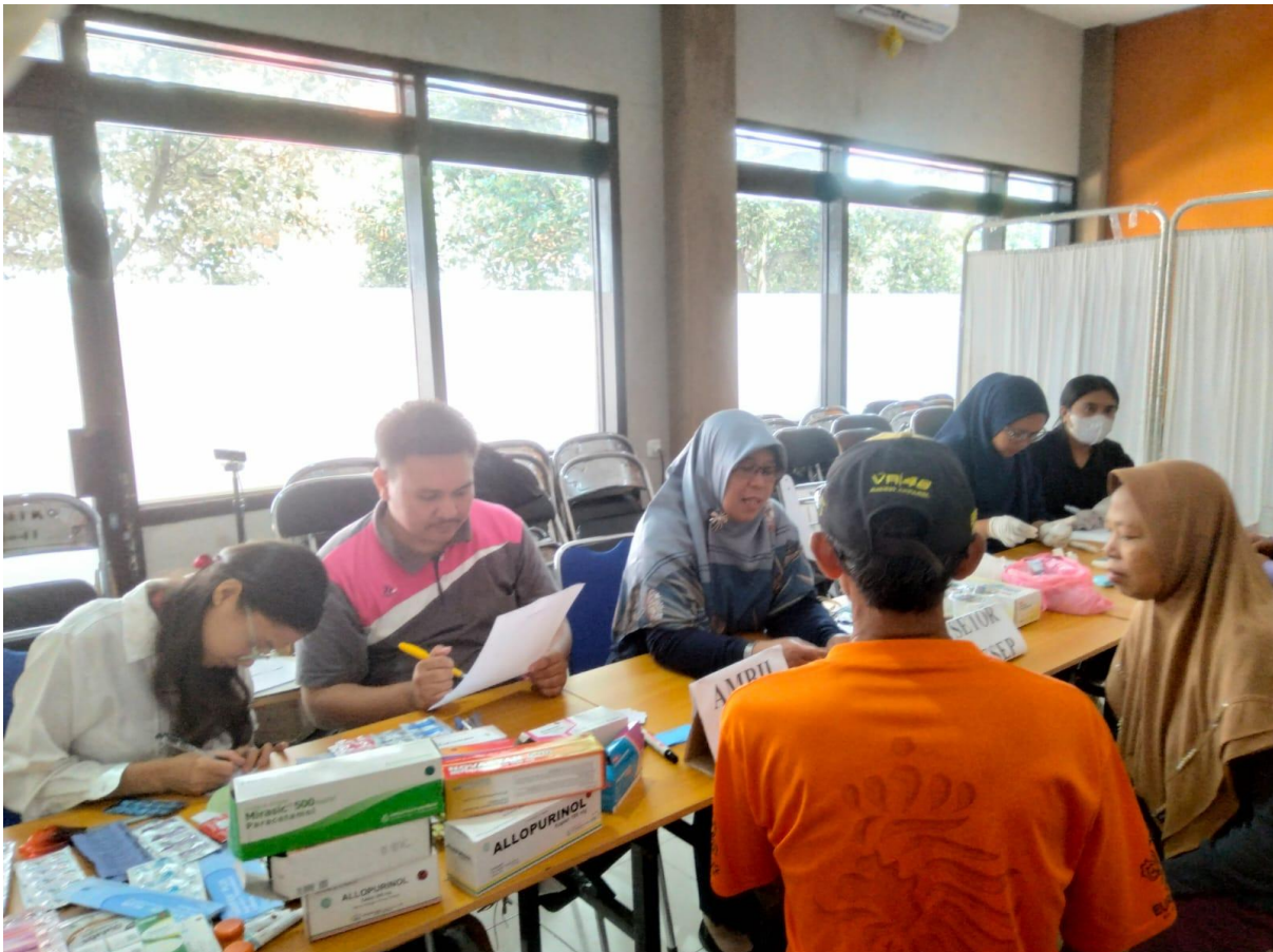
Gambar 3. Pos pelayanan kefarmasian

Dari hasil pelaksanaan kegiatan pemeriksaan kesehatan dan pengobatan gratis mendapatkan sambutan yang baik dari semua pihak. Warga terlihat antusias untuk mengikuti kegiatan pemeriksaan kesehatan dan pengobatan gratis ini. Kegiatan ini juga dapat mengurangi beban biaya masyarakat untuk berobat, serta memberikan akses yang lebih mudah dan terjangkau terhadap layanan kesehatan yang penting bagi kesejahteraan mereka. Namun, kurangnya kesadaran masyarakat akan pentingnya kesehatan, kurangnya informasi atau edukasi kesehatan keterbatasan waktu dan alat menjadi salah satu masalah dalam kegiatan ini. Solusinya, untuk kegiatan ke depan, adalah dengan melaksanakan kampanye penyuluhan kesehatan secara berkala untuk meningkatkan kesadaran masyarakat, mengembangkan program mobile atau unit kesehatan bergerak untuk mencapai wilayah-wilayah terpencil, meningkatkan program pendidikan kesehatan komunitas untuk memberikan informasi yang lebih lengkap dan mudah dipahami tentang kesehatan serta menyusun jadwal yang lebih terstruktur.