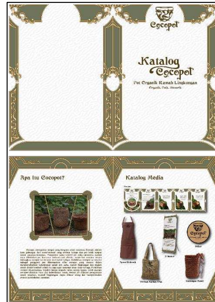
Gambar 5. Katalog ILM