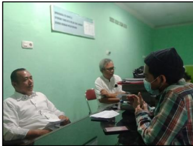
Gambar 2. Wawancara untuk mendapatkan data informasi yang valid.