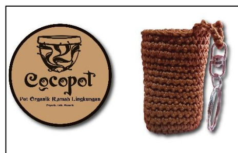
Gambar 7. Stiker dan Gantungan Kunci