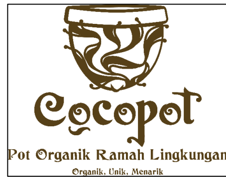
Gambar 3. Logo ILM