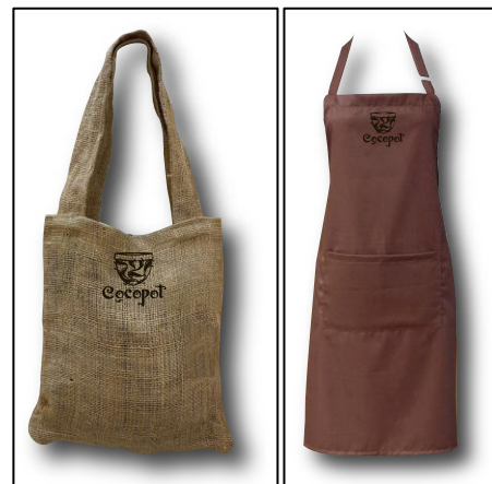
Gambar 6. Totebag dan Celemek