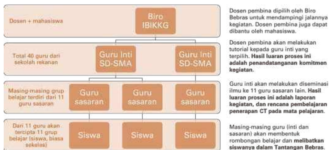
Gambar 2. Skema Kegiatan Gerakan Pandai

Hasil luaran dari proses diseminasi ini adalah laporan kegiatan, materi kegiatan, dan rencana pembelajaran penerapan CT ke mata pelajaran yang diajar (satu lembar) yang dibuat oleh masing-masing guru yang terlibat (guru inti dan guru sasaran). Biro Bebras akan mendampingi proses pembuatan dokumen hasil luaran dan akan memvalidasi hasil luaran.