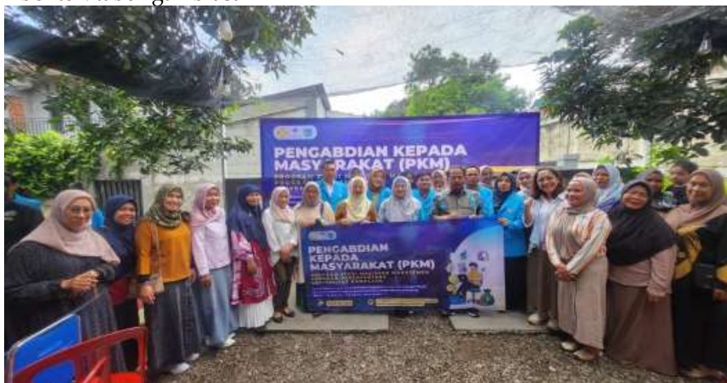
Gambar 1.3 Tim Kelompok bersama ketua dan pelaku UMKM Kampung 7 muara Kecamatan Bojongsari, Kota Depok serta dosen pembimbing Universitas Pamulang

Berdasarkan diskusi dan pengamatan, keadaan awal pengelolaan keuangan peserta menunjukkan bahwa 80% peserta masih melakukan pencatatan keuangan secara manual dengan cara yang sangat dasar, bahkan 30% di antaranya tidak mencatat sama sekali. Hampir semua partisipan (95%) belum memisahkan keuangan pribadi dari keuangan usaha, sebagian besar partisipan (85%) hanya merencanakan keuangan untuk kebutuhan harian atau mingguan, dan sebanyak 90% partisipan belum paham konsep investasi produktif serta lebih suka menyimpan keuntungan dalam bentuk tabungan biasa