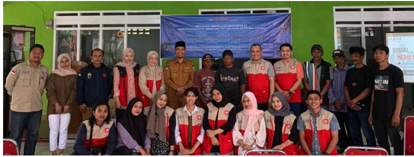
Gambar 2(b). Pemaparan Materi Pelatihan

Selain pelatihan teori, kegiatan juga dilengkapi dengan praktik langsung seperti pembuatan akun toko pada platform e-commerce , pengunggahan produk ke marketplace , serta pembuatan konten promosi sederhana menggunakan telepon pintar. Peserta juga diberikan pelatihan mengenai teknik dasar fotografi produk dan penulisan deskripsi produk yang menarik untuk meningkatkan daya tarik produk rumput laut di pasar digital. Melalui kegiatan ini, peserta mulai memahami cara memanfaatkan teknologi digital sebagai sarana pemasaran serta mulai mempraktikkan promosi produk melalui berbagai platform online .