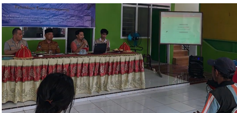
Gambar 2(a). Pemaparan Materi Pelatihan

Tahap pelaksanaan difokuskan pada kegiatan pelatihan dan pendampingan pemasaran digital yang melibatkan para pembudidaya rumput laut sebagai peserta aktif. Materi pelatihan meliputi pengenalan konsep digital marketing, pembuatan akun marketplace, pemanfaatan media sosial sebagai media promosi, serta penggunaan WhatsApp Business untuk komunikasi dengan pelanggan.