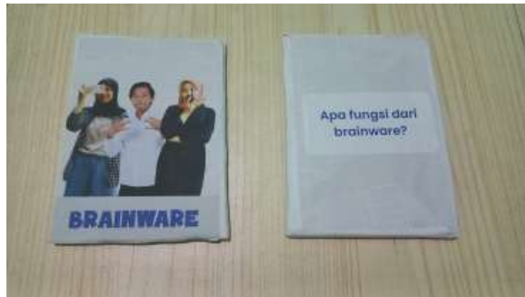
Gambar 2. Tampilan flashcard

Produk yang dihasilkan berupa flashcard dengan menggunakan kardus dan dilapisi dengan kertas yang telah di desain sebelumnya. Flashcard ini memiliki ukuran 14x10 cm dengan jumlah 48 buah dan 24 jenis kartu yang berbeda. Berikut adalah desain dari kartu flashcard :