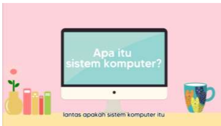
Gambar 3. (Cuplikan Video Pembelajaran)

Dalam penyusunan konten video, peneliti mengambil materi yang sesuai dengan pembelajaran di kelas VII. Video berdurasi tidak lebih dari lima menit, karena akan membuat siswa merasa bosan dan jenuh. Tujuan dibuatnya video ini adalah untuk meningkatkan pemahaman dan memperjelas materi pelajaran yang diberikan. Berikut adalah contoh dari cuplikan video: