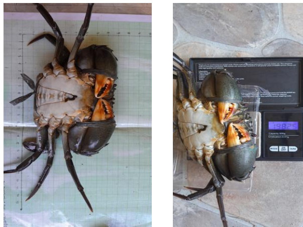
Figure 2. Average carapace length and weight of crabs

Penggunaan transek berbahan pipa PVC berukuran 1x1 meter terbukti efektif sebagai alat bantu pengamatan dan penentuan area sampling. Bubu kotak berukuran 43x28x16 cm mampu menangkap kepiting secara selektif dengan tingkat kerusakan tubuh minimal. Hal ini dibuktikan dengan hasil tangkapan dari tiga lokasi rata-rata panjang karapas kepiting yang tertangkap berkisar antara 6 cm sampai 7 cm dengan rata-rata bobot 198 gram (Figure 2).