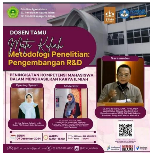
Gambar 2. Tahap Persiapan Kegiatan

Pelaksanaan Program Kemitraan Masyarakat (PKM) melalui pendekatan pendampingan partisipatif berbasis kolaboratif ( participatory and collaborative mentoring approach ) menunjukkan dinamika perubahan yang bertahap namun signifikan dalam pengembangan kurikulum Pendidikan Agama Islam (PAI) yang responsif terhadap keberagaman. Proses yang dilakukan tidak hanya menghasilkan dokumen kurikulum yang direvisi, tetapi juga membentuk transformasi paradigma keberagaman, penguatan kompetensi pedagogik, serta pembentukan budaya reflektif dalam komunitas mitra. Hasil kegiatan berikut dianalisis berdasarkan tahapan metode secara sistematis dan mendalam.