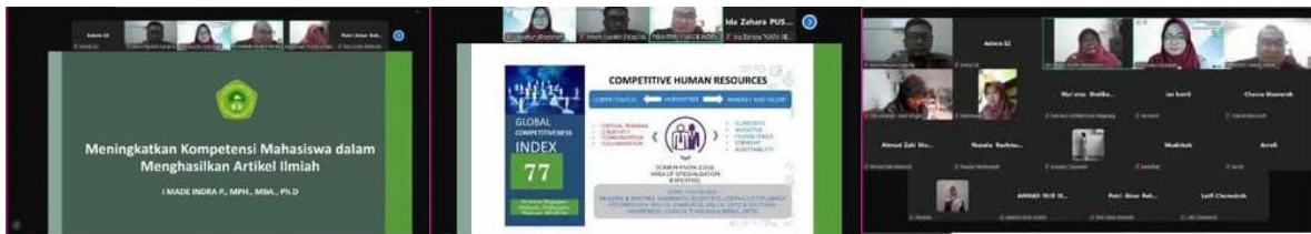
Gambar 3. Pelaksanaan kegiatan

Integrasi nilai tasamuh dan moderasi beragama dalam capaian pembelajaran menunjukkan bahwa dimensi afektif dan sosial memperoleh perhatian yang lebih besar dibandingkan sebelumnya. Kurikulum tidak lagi didominasi aspek kognitif semata, tetapi memperhatikan keseimbangan antara pengetahuan, sikap, dan keterampilan sosial. Keseimbangan ini penting karena pembentukan sikap toleran tidak cukup melalui pemahaman konseptual, melainkan melalui pengalaman dialogis dan reflektif yang berulang.