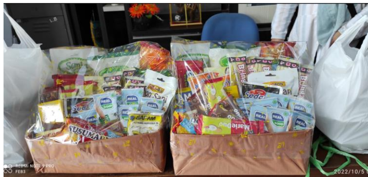
Gambar 2. Contoh paket bahan makanan yang diberikan oleh bapak asuh

Kekurangan lain dari model BAAS ini adalah tidak adanya kontrol terhadap ketaatan dan kedisiplinan dari keluarga sasaran dalam memberikan makanan bergizi. Pendamping juga tidak bisa melakukan cek setiap hari ke rumah tangga sasaran. Sebagian besar anak yang terindikasi stunting berasal dari keluarga kurang mampu, dimana sebagian besar ibunya bekerja di pabrik dari pagi hingga sore dan pengasuhan anak diserahkan kepada nenek atau anggota keluarga yang lain. Seringkali, perhatian kepada tumbuh kembang anak juga kurang.