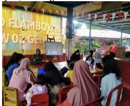
Gambar 1 Dokumentasi Kegiatan

Kegiatan dilaksanakan pada Kamis, 5 Desember 2024, pukul 08.00-10.00, berlokasi di BKB PAUD Flamboyan. Realisasi kegiatan ini diikuti oleh 8 orang tua siswa dan 3 orang pengurus BKB PAUD Flamboyan, Gedong.