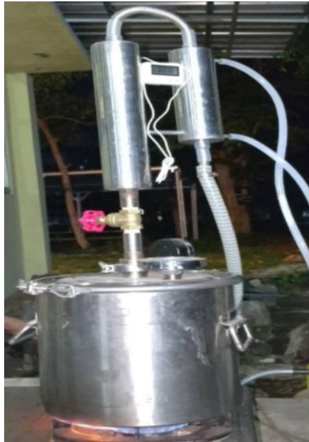
Gambar 2. Destilator

Bahan baku yang digunakan pada penelitian ini yaitu :