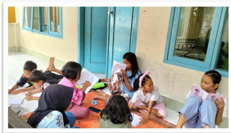
Gambar 2. Dokumentasi kegiatan Diskusi

Mahasiswa belajar mengedepankan pendekatan moderasi beragama, yang terbukti mendorong kemampuan berpikir kritis, toleran, dan adaptif dalam menghadapi variasi pandangan masyarakat terkait praktik keberagaman. Situasi ini memperkaya pengalaman mahasiswa dalam mengelola dinamika diskusi dan membangun hubungan sosial yang positif.