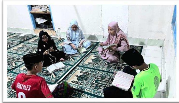
Gambar 1. Dokumentasi kegiatan pembinaan TPQ dan pembiasaan ibadah

Selain itu, pemberian buku tajwid, iqra', Al-Qur'an, dan buku bacaan memperkuat proses belajar anak-anak dan menjadi bentuk dukungan nyata terhadap keberlanjutan pendidikan nonformal di TPQ.