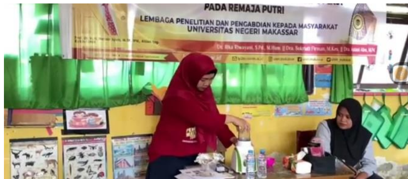
Gambar 5. Proses penghalusan rumput laut

masing-masing saat pelatihan telah selesai dilaksanakan. Selama kegiatan ini berlangsung proses tanya jawab bersama mitra sasaran tetap berlangsung.