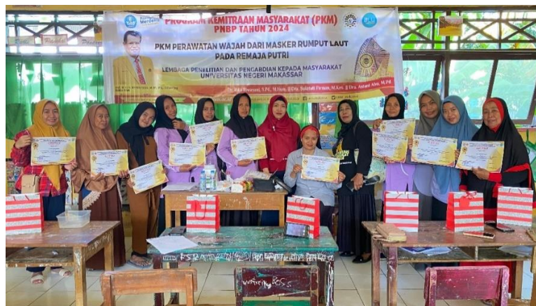
Gambar 8. Foto bersama peserta dan Ibu Lurah

Para peserta terlihat aktif saat sesi tanya jawab berlangsung, terlebih lagi mengenai proses pembuatan masker bubuk rumput laut karena para peserta tidak mengetahui bahwa pembuatan masker bubuk rumput laut untuk perawatan wajah. Para peserta banyak yang antusias karena selama proses pelaksanaan kegiatan diselingi dengan games, bila dapat menjawab pertanyaan dan bisa menyelesaikan proses pembuatan akan mendapatkan hadiah kenang-kenangan dari tim pengabdian.