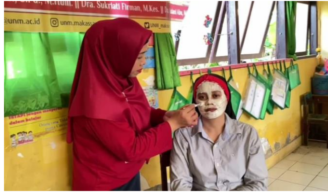
Gambar 7. Pengaplikasian masker bubuk rumput laut

Para peserta terlihat aktif saat sesi tanya jawab berlangsung, terlebih lagi mengenai proses pembuatan masker bubuk rumput laut karena para peserta tidak mengetahui bahwa pembuatan masker bubuk rumput laut untuk perawatan wajah. Para peserta banyak yang antusias karena selama proses pelaksanaan kegiatan diselingi dengan games, bila dapat menjawab pertanyaan dan bisa menyelesaikan proses pembuatan akan mendapatkan hadiah kenang-kenangan dari tim pengabdian.