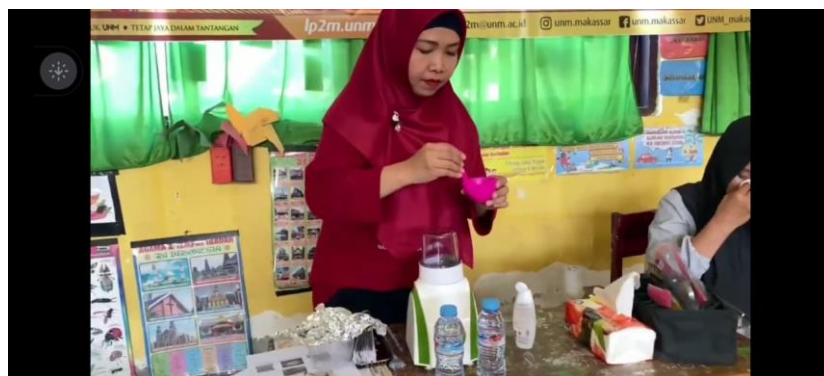
Gambar 6. Pencampuran masker bubuk dan air mawar 2:1

Setelah tim PKM mendemonstrasikan proses pembuatan masker bubuk rumput laut untuk perawatan wajah, maka dilanjutkan dengan mencampur masker bubuk rumput laut dengan air mawar. Pencampuran dengan perbandingan 2:1 yang berarti 2 sendok masker bubuk rumput laut campur 1 sendok air mawar menjadi kekentalan yang sedang sehingga siap untuk diaplikasikan ke wajah oleh tim PKM. Peserta dilibatkan sebagai model yang akan dirawat wajahnya dengan masker bubuk rumput laut sehingga mengetahui langsung manfaatnya. Hal ini bertujuan agar mitra sasaran memahami dengan jelas langkah-langkah pengaplikasian dari inovasi masker bubuk rumput laut yang dilatihkan dan mitra sasaran dapat mempraktekkan secara mandiri di rumah masing-masing.