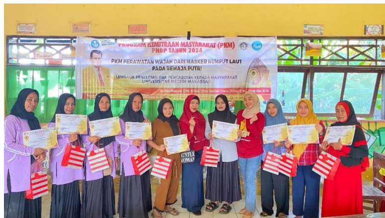
Gambar 9. Foto bersama peserta