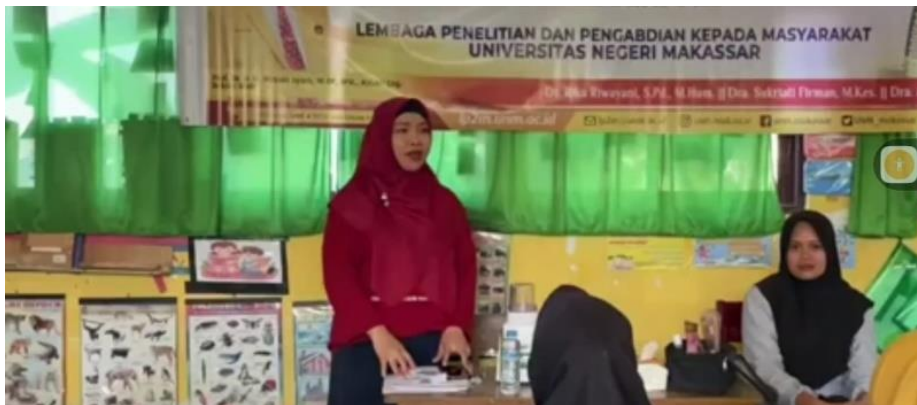
Gambar 3. Proses Pemaparan Materi

Berdasarkan hasil wawancara dapat diketahui bahwa sebagian besar mitra sasaran cenderung kurang mengetahui manfaat rumput laut bisa dijadikan masker bubuk untuk perawatan wajah. Selama ini mitra sasaran hanya mengetahui rumput laut menjadi bahan makan dan dibuar agar-agar. Berdasarkan hasil wawancara pengetahuan dan keterampilan mitra sasaran meningkat setelah kegiatan pelatihan dilaksanakan.