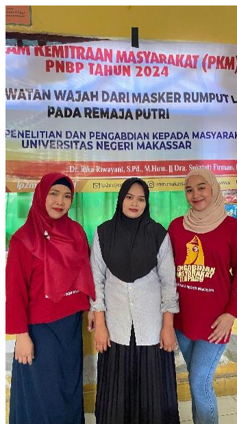
Gambar 1. Tim Pengabdian dan Peserta sebagai Model

Pembuatan masker bubuk rumput laut untuk perawatan wajah melatih diri berinovasi dengan memanfaatkan bahan alami yang ada dan juga menimbulkan jiwa kewirausahaan karena menghasilkan produk yang mempunyai nilai kreativitas dan nilai jual, serta kedepannya mereka lebih mandiri dan inovatif.