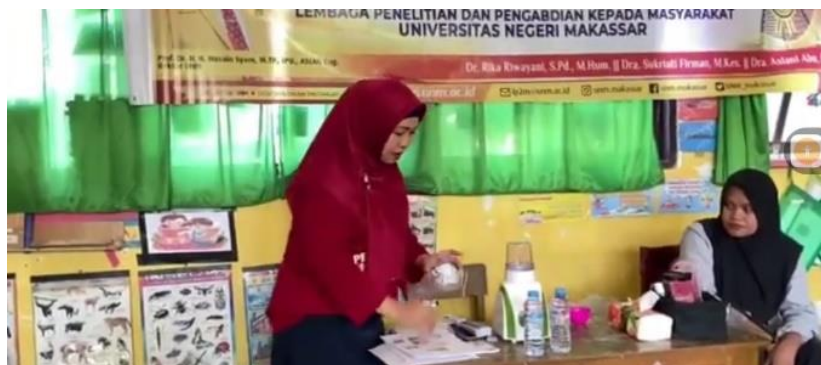
Gambar4. Pengenalan alat, bahan dan kosmetik

Pada tahap ini, tim PKM memaparkan alat dan bahan yang akan digunakan beserta langkah langkah pembuatannya. Pembuatan masker bubuk rumput laut yang akan dilatihkan kepada mitra sasaran untuk perawatan wajah. Produk masker bubuk rumput laut ini diharapkan dapat menjadi awal pentingnya perawatan wajah dengan bahan alami dan dapat dibuat sendiri, sehingga dapat menjadi peluang usaha remaja putri yang berbeda dari sebelumnya.