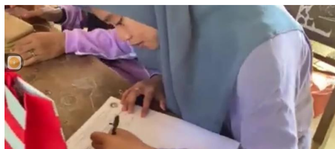
Gambar 2. Peserta mengisi lembar kehadiran