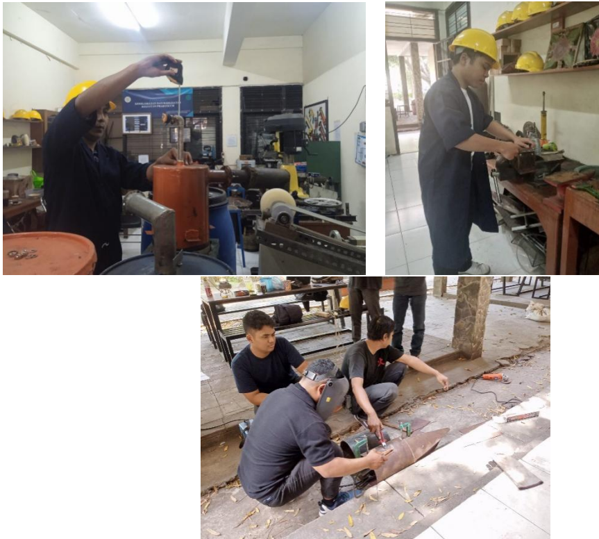
Gambar 3 Kegiatan Mahasiswa di Laboratorium Manufaktur

Berikut data kecelakaan kerja yang terjadi sejak tahun 2019 – 2023 yang didapat dari hasil wawancara dengan kepala laboratorium.