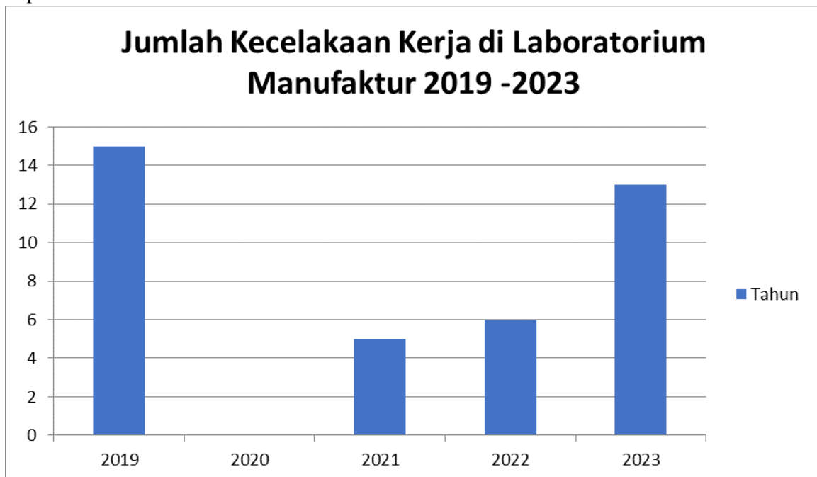
Gambar 4 Data Jumlah Kecelakaan Kerja di Laboratorium Manufaktur 2019 -2023

Berikut data kecelakaan kerja yang terjadi sejak tahun 2019 – 2023 yang didapat dari hasil wawancara dengan kepala laboratorium.