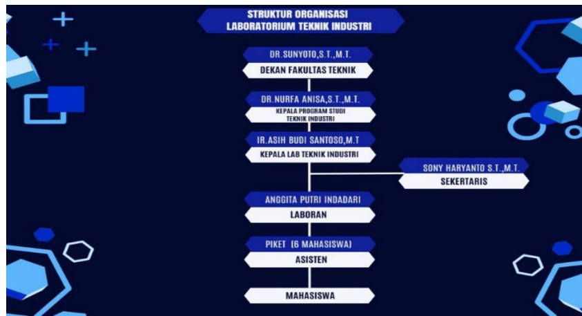
Gambar 2. Struktur Organisasi Laboratorium Teknik Industri

Sedangkan tata ruang laboratorium meliputi: