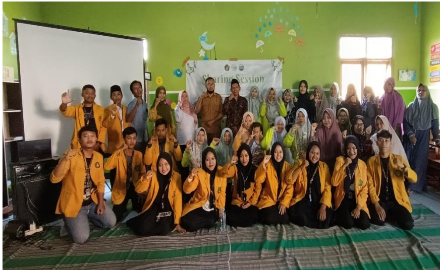
Gambar 4. Dokumentasi bersama pada acara pengabdian