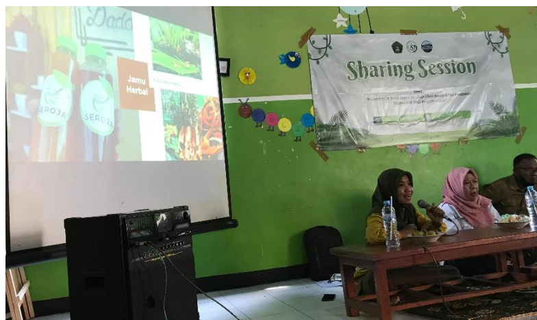
Gambar 3. Sosialisasi Toga

yang paling banyak adalah ibu-ibu berusia 36-45 tahun. Hal ini menunjukkan bahwa ilmu tentang Toga menjadi menarik untuk para ibu-ibu rumah tangga dan memang pelaku budidaya beberapa tanaman Toga di halaman rumah mereka adalah para ibu-ibu. Informasi awal dari data hasil Pre-test menunjukkan bahwa masyarakat lebih banyak menanam tanaman dari family Zingiberaceae seperti kunyit, jahe, lengkuas dan kencur. Hal ini dikarenakan tujuan utama mereka adalah sebagai bahan rempah masakan sehari-hari. Selain family tersebut adalah spesies yang banyak juga ditanam seperti seledri dan cabai. Sehingga salah satu tujuan utama dalam kegiatan pengabdian ini adalah memberikan pemahaman kepada masyarakat bahwa sebenarnya Toga yang mereka tanam ini memiliki khasiat sebagai obat. Pemahaman tentang manfaat tanaman yang berkhasiat sebagai obat masih belum maksimal di masyarakat, masih rendahnya pengetahuan dan perilaku masyarakat dalam pemanfaatan TOGA bagi kesehatan dan ekonomi keluarga. Hal ini disebabkan karena rendahnya pengetahuan masyarakat tentang jenis tanaman dan manfaatnya bagi kesehatan dan meningkatkan ekonomi keluarga (Amran dan Rahman, 2024).