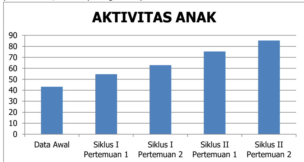
Gambar 2. Diagram Aktivitas Anak

Berdasarkan pembahasan di atas diketahui bahwa aktivitas anak mengenal huruf hijaiyah meningkat dari data awal hingga data siklus II pertemuan 2, berikut peningkatannya: