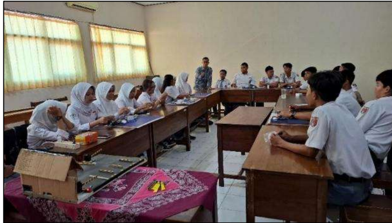
Gambar 4. Pengenalan Modul dan Pendampingan Para Siswa

Pada Gambar 3 menjelaskan pemberian materi oleh Tim Pengabdian kepada mitra siswa siswi SMA PGRI 1 Kendal. Materi tim pengabdian berupa konsep dasar Internet of Things dan aplikasi Internet of Things dalam kehidupan sehari-hari. Setelah pemberian materi, selanjutnya Tim Pelaksana Pengabdian memperkenalkan alat dan bahan yang digunakan dalam merancang prototype palang parkir otomatis. Alat alat praktek berupa papan, arduino uno, motor servo mini, kabel jumper male to male, male ke female, catu daya dan Project board. Pengenalan modul dan pendampingan siswa ditunjukkan pada Gambar 4.