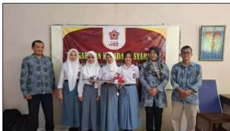
Gambar 7. Pemberian Reward Prototype Terbaik Siswa Siswi SMA PGRI 1 Kendal

Hasil dari kegiatan ini selain memberikan pelatihan kepada para siswa, Tim Pengabdian Universitas Ivet juga memberikan alat dan bahan untuk diberikan kepada pihak sekolah. Dengan harapan pemberian alat dan bahan ini bisa membantu para siswa yang ingin lebih mempelajari tentang sistem palang parkir otomatis. Selain itu Tim Pengabdian Kepada Masyarakat memilih 3 hasil prototype terbaik hasil buatan para siswa untuk mendapatkan reward penghargaan souvenir dari Tim Pengabdian Universitas Ivet mereka sangat antusias. Karena penilaian prototype didasarkan pada inovasi design dan sistem palang parkir otomatis berfungsi dengan baik tanpa ada error coding dari alat dan bahan yang sudah ada. Meskipun siswa siswi mengalami kendala dalam hal coding program mereka tanpa patah semangat menulis coding dan memeriksa coding jika terdapat syntax error . Selain itu Tim Pengabdian Kepada Masyarakat Universitas Ivet juga memberikan satu buah produk prototype ke SMA PGRI 1 Kendal. Pemberian reward prototype terbaik dapat ditunjukkan pada Gambar 7.