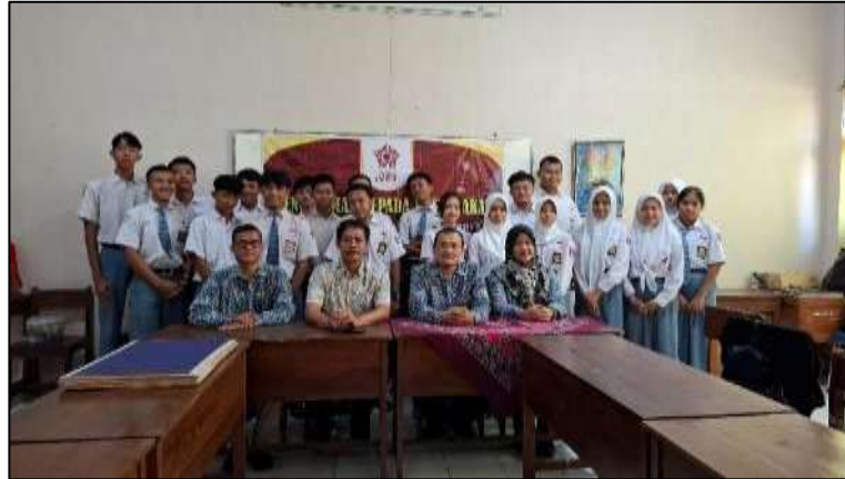
Gambar 6. Kegiatan Pengabdian Masyarakat di SMA PGRI 1 Kendal

Pada Gambar 6 menunjukkan kegiatan pengabdian masyarakat foto bersama Tim Pengabdian, siswa siswi SMA PGRI 1 Kendal dan Kepala Sekolah. Kepala Sekolah sangat senang dengan adanya pengabdian masyarakat yang dilakukan dalam sambutan Kepala Sekolah menyampaikan hal tersebut. Foto bersama dilakukan pada awal pelatihan.