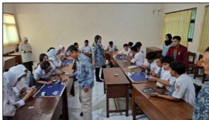
Gambar 5. Suasana Ketika Merangkai Alat dan Bahan Palang Parkir Otomatis

Pada Gambar 4 menjelaskan para siswa akan diperkenalkan dengan alat dan bahan yang akan digunakan saat pelatihan berlangsung oleh Tim Pengabdian. Alat dan bahan tersebut akan di dirangkai sesuai dengan skematik rangkaian sistem palang parkir otomatis yang ada pada modul pembelajaran. Para siswa sudah diperkenalkan dengan modul-modul palang parkir otomatis. Selama pelatihan, siswa-siswa tersebut didampingi oleh Tim Pengabdian Universitas Ivet dan dibagi menjadi beberapa kelompok. Kemudian Tim Pengabdian membagikan alat alat tersebut kepada siswa yang terdiri dari 5 kelompok. Suasana ketika merangkai alat dan bahan palang parkir otomatis ditunjukkan pada Gambar 5.