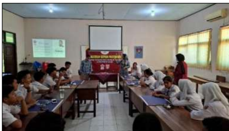
Gambar 3. Pemberian Materi Oleh Tim Pengabdian Kepada Mitra

Agenda kegiatan berikutnya adakah memberikan materi dan Pre-Test berkaitan pengetahuan Internet of Things (IoT) dan sistem palang parkir otomatis kepada siswa. Hasil Pre-Test menunjukkan 0% para siswa tidak tau sama sekali berkaitan hasil tersebut. Dilanjutkan pada bagian ini pemateri akan mejabarkan IoT dan pengaplikasiannya pada prototype palang parkir otomatis. Tim PkM melakukan tanya jawab pada siswa sejauh mana mereka mengetahui IoT dan pengaplikasiannya dalam kehidupan sehari-hari. Selain itu siswa diminta untuk mencoba memperagakan prototype aplikasi IoT secara langsung dengan tujuan untuk menarik perhatian para siswa. Pemberian materi menggunakan modul yang sudah disiapkan oleh tim pengabdian masyarakat. Modul dibagikan pada tiap siswa, sehingga lebih memahami dalam kegiatan pembelajaran. Pemberian materi oleh Tim Pengabdian Universitas Ivet ditunjukkan pada Gambar 3.