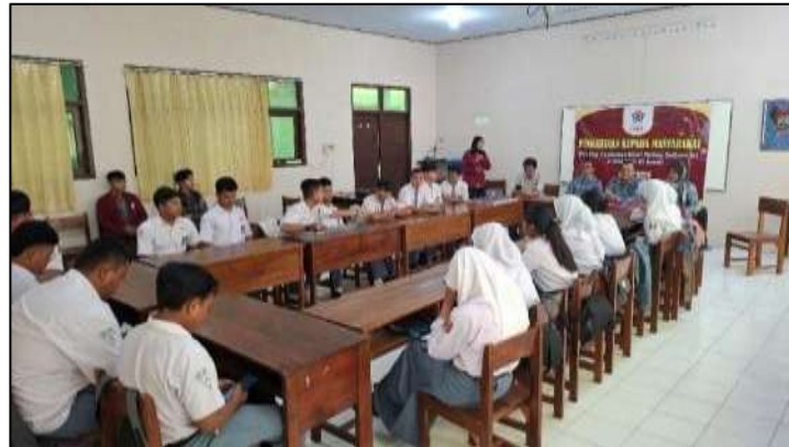
Gambar 2. Pembukaan Pelatihan Oleh Tim Pengabdian Kepada Mitra

Pada Gambar 2 menjelaskan pembukaan pelatihan oleh tim pengabdian kepada mitra SMA 1 PGRI Kendal, para siswa sangat antusias mendengarkan sambutan ketua panitia pentingnya Internet of Things dalam revolusi 5,0 ini. Sebelumnya dari pihak Kepala Sekolah mmeberikan samabutan terlebih dahulu dan sangat apresiasi dengan adanya pengabdian masyarakat ke siswa berkaitan Internet of Things.