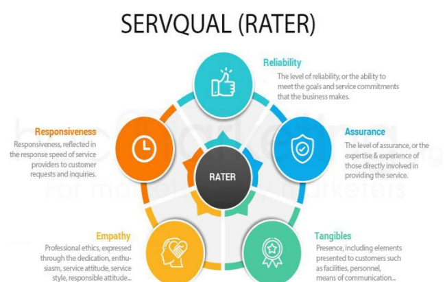
Gambar 1. Metode SERVQUAL Pelayanan Cek Fisik Regident Ranmor

Populasi dalam penelitian ini adalah seluruh masyarakat yang melakukan pelayanan cek fisik kendaraan bermotor di SAMSAT Kota Palangka Raya. Teknik pengambilan sampel dilakukan dengan metode accidental sampling, yaitu pemilihan responden berdasarkan siapa saja yang secara kebetulan berada di lokasi pelayanan dan bersedia mengisi kuesioner. Jumlah responden ditentukan sebanyak 100 orang, yang dianggap telah mewakili variasi pengguna layanan dari berbagai latar belakang demografis, seperti usia, jenis kelamin, dan tingkat pendidikan. Teknik ini dipilih karena pertimbangan efisiensi waktu dan kemudahan dalam menjangkau pengguna layanan secara langsung di lokasi pelayanan.