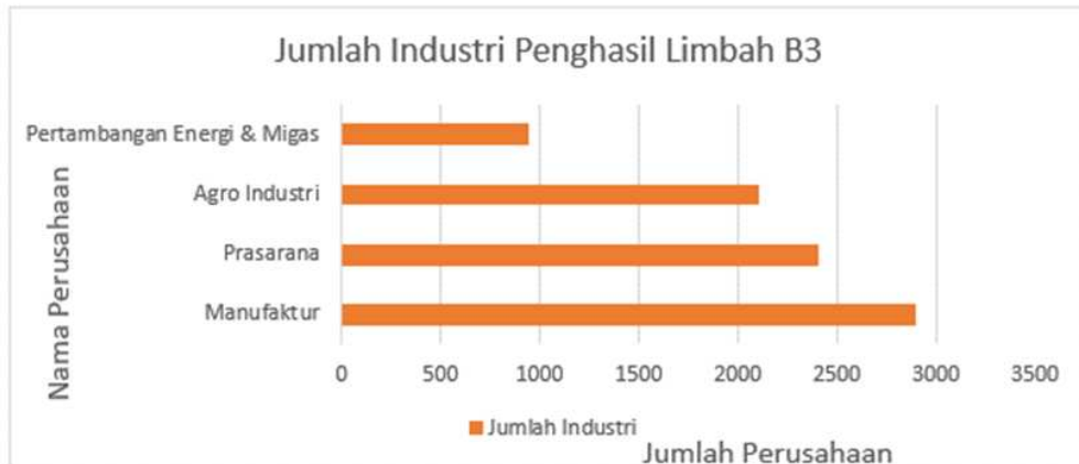
Gambar 3 Jumlah Perusahaan Penghasil Limbah B3 per Sektor