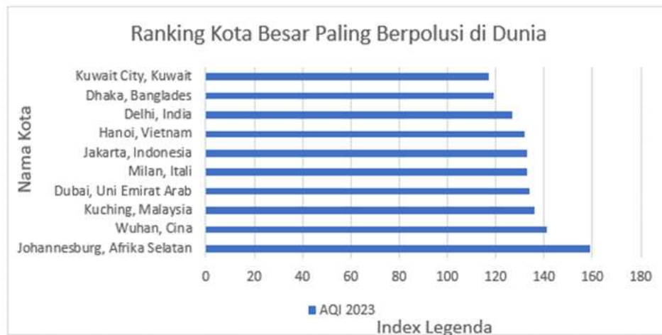
Gambar 2 Ranking Kota Besar Paling Berpolusi di Dunia