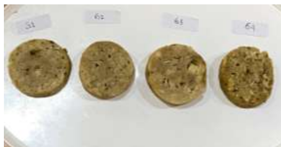
Gambar 2. Perbandingan Galantin Rasio G1, G2, G3, G4

Nilai L*, a*, dan b* yang diperoleh oleh galantin dipengaruhi oleh pigmen warna dari ikan kembung dan jamur, senyawa non-volatil, dan reaksi kimia. Ikan kembung mengandung pigmen berwarna kuning yang berasal dari beta karoten, lutein, dan taraxanthin. Kemudian pigmen yang menghasilkan warna merah dari astaxanthin dan canthaxanthin. Adapula pigmen melanian dan guanian yang menghasilkan warna coklat sampai kehitaman pada ikan (Dokterikan, 2024). Di sisi lain, jamur merang menghasilkan warna kecoklatan hingga kehitaman pada jamur merang adalah melanin (Wikipedia, 2024).