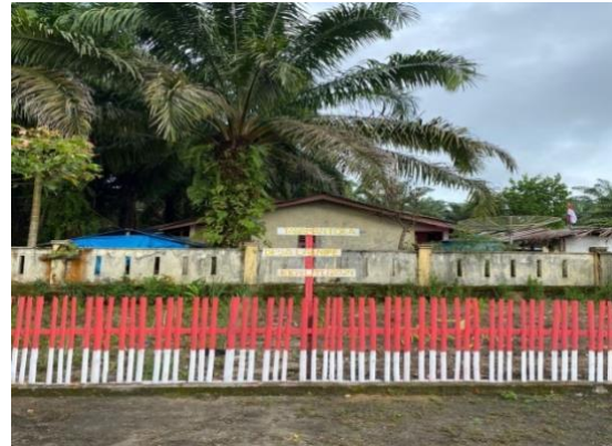
Gambar 3 Hasil akhir pembuatan tanaman Toga

Setelah pelatihan pembuatan taman herbal selesai, Sebagian besar peserta memberikan apresiasi kepada kelompok pelatihan, terutama terkait metode penanaman tanaman herbal. Tim pelatihan tetap bersemangat menjalankan kegiatan pengabdian masyarakat ini hingga selesai. Ke depannya, peserta yang telah mengikuti pembuatan taman herbal akan memperoleh pengetahuan baru tentang proses penanaman dan pembuatan taman herbal. Pengetahuan ini penting agar berbagai tanaman herbal dapat berfungsi sebagai obat alami dan berkontribusi pada peningkatan kesehatan masyarakat.