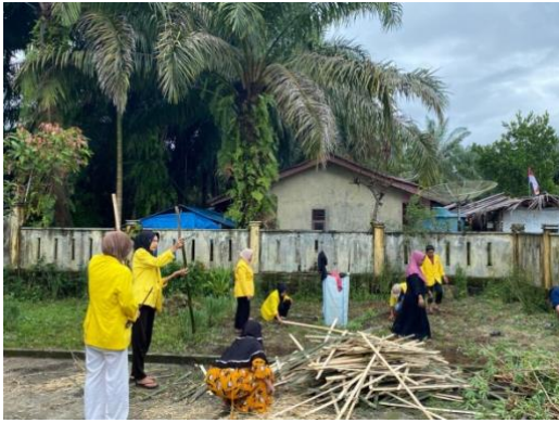
Gambar 2 Gotong Riyong pembuatan Toga bersama Masyarakat Lae Nipe di kantor Pokesdes